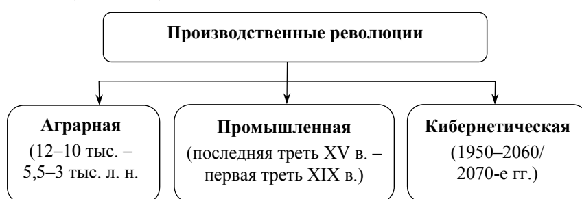
Рис. 1. Производственные революции в истории

Смена принципов производства связана с началом и совершенствованием производственных революций. Речь идет: 1) об аграрной революции; 2) промышленной революции; 3) кибернетической революции (см. Рис. 1).