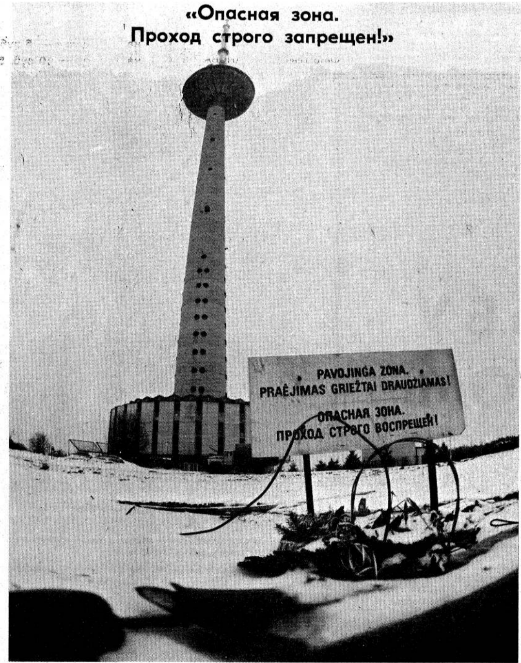
Эта чеканная надпись начертана военными в Вильнюсского телецентра. В ней — суть политической власти по отношению к средствам массовой информации. В ней — концентрация многолетнего опыта управления печатью и телевидением. Эта надпись — печальный символ нашего времени. Но в ней не хватает еще одной фразы, логично завершающей окрик: «Стреляем без предупреждения!».

Пресс-служба Президиума Верховного Совета РСФСР.