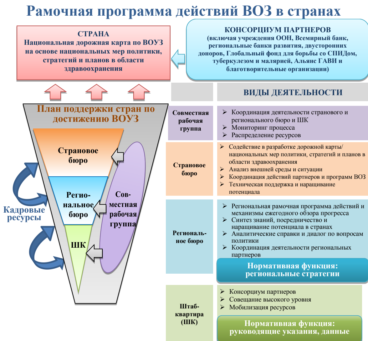
Рисунок 4. Оказание поддержки странам в продвижении ВОУЗ совместно с привлеченными партнерами и в партнерстве с самими странами

Чрезвычайные ситуации в области здравоохранения – обеспечить более эффективную защиту при чрезвычайных ситуациях в области здравоохранения дополнительно 1 миллиарда человек