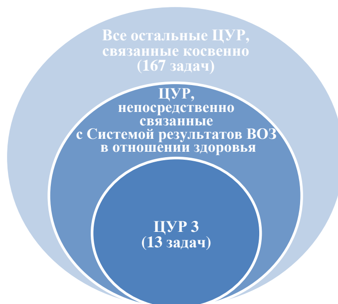
Рисунок 3. Вопросы здоровья в ЦУР

20. Меры, касающиеся социальных, экологических и экономических детерминант здоровья, требуют многосекторальных подходов, обеспечивающих соблюдение прав человека. Многосекторальные действия занимают центральное место в повестке дня ЦУР в связи с тем, что на здоровье человека оказывает влияние целый ряд