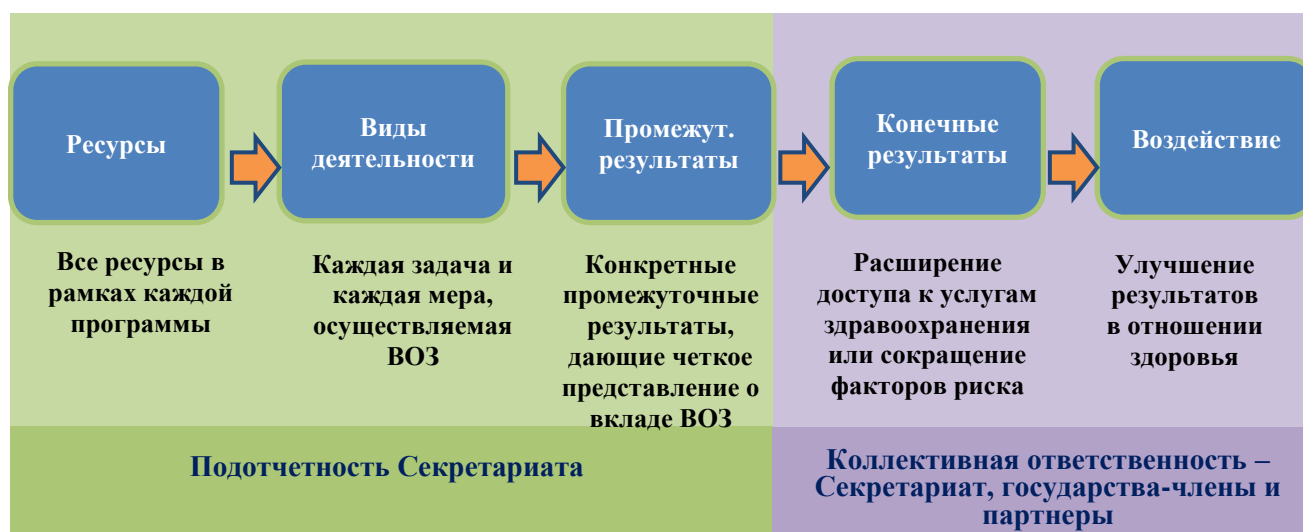
Рисунок 6. Система оценки результатов работы и подотчетности ВОЗ

125. В соответствии с принятым в ОПР 13 подходом, ориентированным на воздействие и конкретные результаты, работа ВОЗ будет организована с учетом восьми конечных результатов в области здравоохранения и двух конечных результатов, касающихся руководящей роли и предоставления возможностей. В совокупности эти конечные результаты будут способствовать реализации трех стратегических приоритетов, сформулированных в ОПР 13. В результате преобразований ВОЗ станет результативной и эффективной организацией, способной выполнять работу, которая представляется необходимой для достижения указанных конечных результатов. В приведенной ниже Вставке 8 в качестве примера представлена предварительная классификация конечных результатов. Она может быть изменена в процессе ее утверждения государствами-членами, так как программный бюджет на 2020–2021 гг. еще находится в стадии разработки.