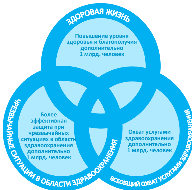
Рисунок 2. ОПР 13: комплекс взаимосвязанных стратегических приоритетов и целей, направленных на обеспечение здоровой жизни и благополучия всех людей в любом возрасте

13. Хотя стратегические приоритеты представлены отдельно, они не являются взаимоисключающими и, таким образом, требуют осуществления взаимодополняющих действий. Например, укрепление систем здравоохранения делает их также более устойчивыми и способными более эффективно выявлять и контролировать вспышки заболеваний до их дальнейшего распространения; и усиление функций общественного здравоохранения способствует оказанию качественной медико-санитарной помощи в рамках ВОУЗ и укреплению систем эпиднадзора, что необходимо для раннего выявления заболеваний и борьбы с ними. Взаимосвязанный характер стратегических приоритетов иллюстрируется на Рисунке 2.