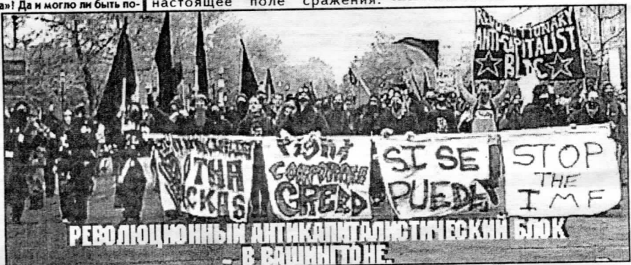
РЕВОЛЮЦИОННЫЙ АНТИКАПИТАЛИСТИЧЕСКИЙ БЛОК - В ВАШИНГТОНЕ.

ФЕДЕРАЦИЯ АНАРХИСТОВ КУБАНИ, анархо-группа «ДИКОВРАЗ»