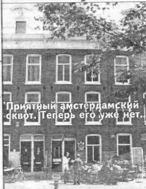
Приятный амстердамский сквот. Теперь его уже нет.

Сегодня все аспекты наших жизней принуждаются к измерению только в денежных единицах. Это логика капитала, логика рынка и товарно-денежных отношений, логика обслуживающей их бюрократии. Это молох, превращающий все вокруг в грязные засаленные кураторы, остановить который может только Социальная Революция - массовый отказ от логики Власти и Иерархии. (использована рассылка агентства ENWL-inf)