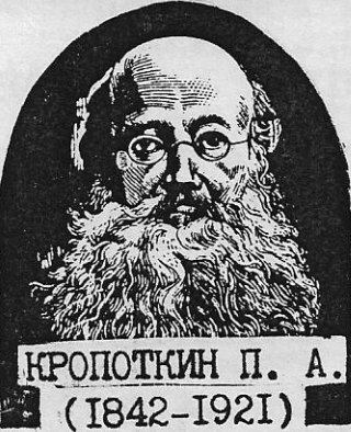
КРОПОТКИН П. А. (1842-1921)

Из „неизданной рукописи“ П. А. Кропоткина, вошедшей в сборник, посвященный 80-летию со дня рождения известного теоретика научного анархизма (г. Серпухов, 1922 г., типография рабочей артели печатников; 3 000 экз.)