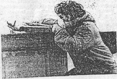
Потерянное поколение: в Ренне (Франция)