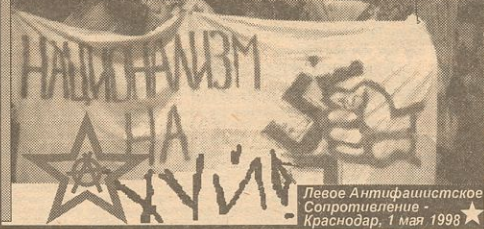
Левое Антифашистское Сопротивление - Краснодар, 1 мая 1998

МАЙКОП. 9 мая участниками С.А.К.-Ф.А.К. и ростовским отделением воеероссийского молодежного движения "Новый курс" в главном штабе в центре города был проведен информационный антифашистский пикет. В последнее время анархизм стало известно, что в Майкопе существует тусовка скинов, собирающаяся регулярно возле "ОНРАДИОМАША". Предварительно были расклеены листовки, проведен опрос местных жителей (хотят ли они иметь у себя в городе такой "подарочек"?). Многие из последних выразили свою озабоченность и удивление фактом существования в их городе людей с нацистскими взглядами. Главная идея пикета в том, что 9 Мая не должен становиться праздником русского милитаризма и державности, а - днем борьбы всех народов бывшего СССР с коричневыми подонками, бурно размножающимися на его территории.