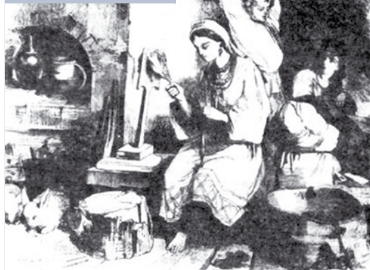
Белорусские крестьяне. Рисунок М. Микешина. 1856 год

Историческая действительность располагает многочисленными подтверждениями антогонистических конфликтов двух частей одного народа в XVII–XIX веках. В их основе лежало противоречие между стремлением «литвинов» действовать в канве политики Римского престола по окатоличиванию жителей ВКЛ, их полной ассимиляции с польской нацией и нежеланием населения Беларуси изменять национальной вере, принимать католичество и польскую культуру. В одном из донесений папского нунция того времени в Польше было замечено: «Не поддается описанию, насколько русский народ ненавидит католиков... при виде римско-католического ксендза они плюют на землю от ужаса и отвращения» [7, с. 393].