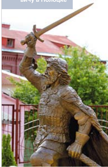
Памятник князю Андрею Ольгердовичу в Полоцке

Пытаясь предотвратить такую ситуацию, король Польши Ягайло и великий князь ВКЛ Сигизмунд в 1432–1434 годах приняли несколько решений о сохранении государственного суверенитета ВКЛ, но в рамках «вечной» унии с Польшей, а также об уравнивании в правах феодалов католиков и православных. В «Жалованной грамоте» великого князя литовского Сигизмунда Кейстутовича от 1434 года записано: «...желаем наши земли Литовские и Руские упорядочить... чтобы между народами этих земель не было никакого раздора... как литовцам, так и руским» [8, с. 71]. Но только в XVI веке, вопреки ожесточенному сопротивлению литовской католической знати, «русских» стали реально допускать к государственным постам, официально отменив в 1563 году запреты второго параграфа Городельской унии. Надо отметить, что эти уступки благоприятно повлияли на общую ситуацию в стране, и белорусская знать в своем большинстве стала добросовестно служить великокняжеской власти. Но это не была их самоидентификация с «литвинами». На белорусских землях под влиянием логики исторических событий шли объективные процессы осознания русинами себя самостоятельной нацией. Подобных выводов придерживается и литовский историк Эдвардас Гудавичюс: «Русские, жившие в