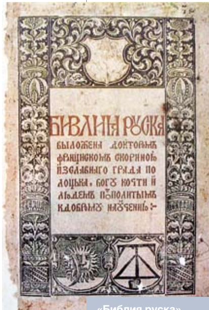
«Библия руская» Франциска Скорины. 1581 год

Но естественный ход формирования белорусской нации резко обрывается после образования польско-литовской федерации в 1569 году (Люблинской унии). С появлением Речи Посполитой дискриминация православно-русской части населения приняла ярко выраженный характер, столкновение восточнославянской и западнохристианской цивилизаций стало бескомпромиссным. В сложившихся обстоятельствах почти вся белорусская знать