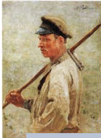
Илья Репин. Косарь-литвин. 1894 год

С другой стороны, со всем основанием сегодня можно сказать, что в ходе своего исторического развития белорусский народ тесно взаимодействовал с польской,