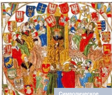
Символическое изображение Горodelьского сейма как симфонии шляхетских гербов

С высоты XXI столетия трудно понять значение в средние века веры, лежавшей в основе общественной психологии и общественного сознания. Она являлась определяющим инструментом этнокультурной идентификации народов, была основным системообразующим фактором всего социального организма. Религия составляла основу духовности личности отдельного че-