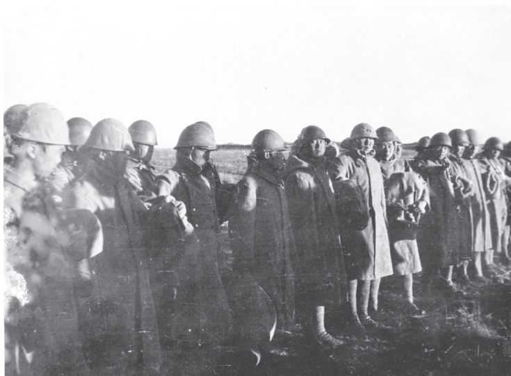
В соответствии с договором по прекращению огня, 27 и 29 сентября 1939 г. 88 военнопленных японцев были переданы японской стороне переодетыми в новое трофейное обмундирование