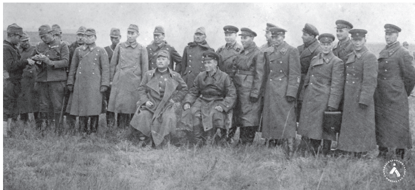
Фото № 7. Коллективная фотография представителей военных комиссий. 20 сентября 1939 г.

Благодаря пониманию сторонами важности дела и ответственному исполнению возложенных на них обязанностей переговоры между военными представителями советско-монгольских и японо-маньчжурских войск шли в нормальной обстановке. 20 сентября по предложению генерал-майора Фудзимото была сделана коллективная фотография военных комиссий, а вечером того же дня, в 18.30 часов, председатель советско-монгольской комиссии М. И. Потапов пригласил японских участников на чай. На приеме, длившемся более 20 мин. в дружественной обстановке, присутствовали 6 человек во главе с генерал-майором Фудзимото, который поднял тост «За расцветание советских войск».