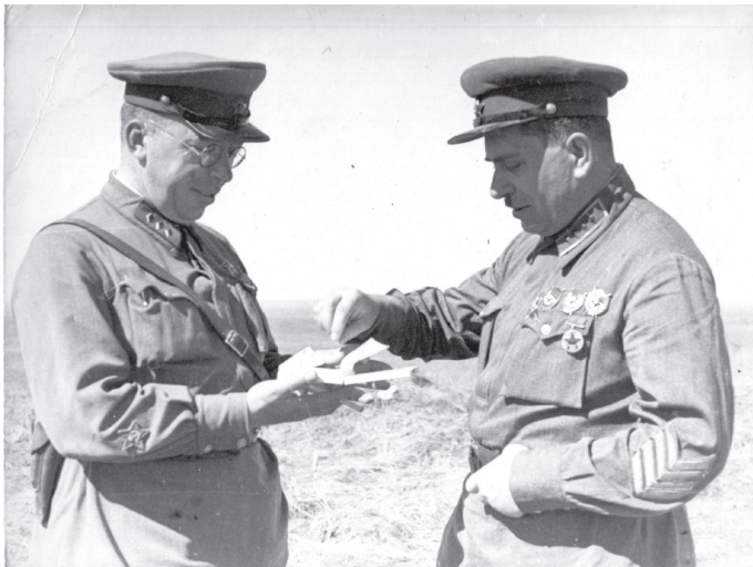
Начальник штаба 1-й Армейской группы, комбриг (17.05.1939, генерал-майор 1942) М. А. Богданов, руководитель фронтовой группы по координации действий РККА и МНРА, командарм второго ранга Г. М. Штерн