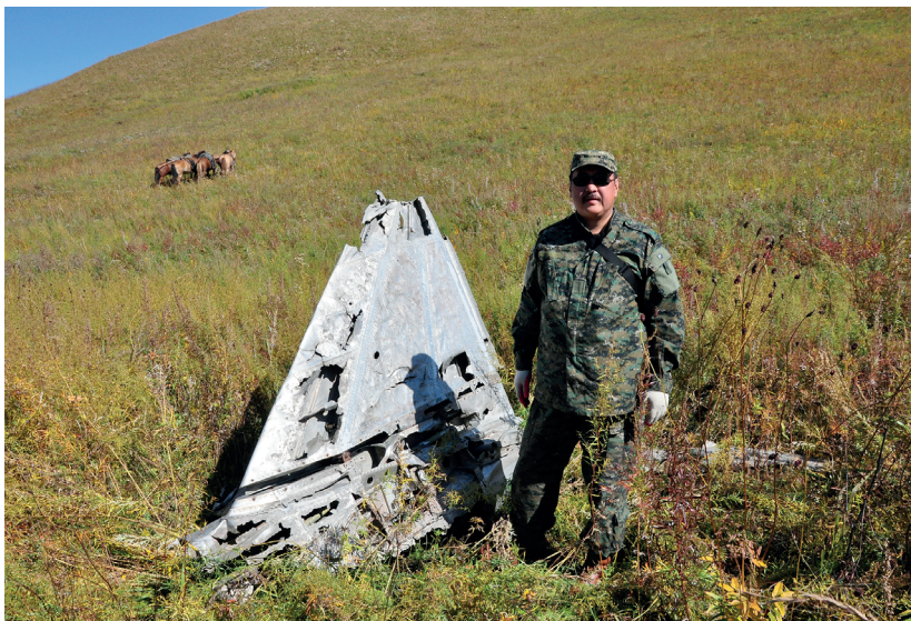
На месте падения японского двухмоторного самолета, в 120 км южнее поселка Халхгол, по номерам двигателя Ю.Свойский установил, что самолет 1944 г. выпуска.