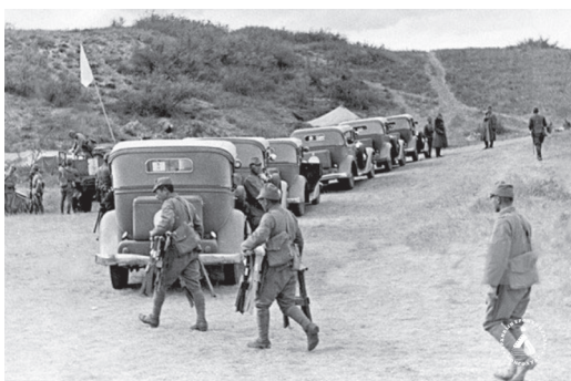
Фото № 2,3. Вид места переговоров. Из документального фильма «Халхин-Гол». Москва. 1940.

В Центральном архиве Обороны Монголии хранится Краткий доклад члена советско-монгольской военной комиссии, начальника Генштаба МНРА, комдива Ж. Цэрэна премьер-министру МНР маршалу Х. Чойбалсану о ходе переговоров с описанием обстановки и изложением итогов каждой из встреч.