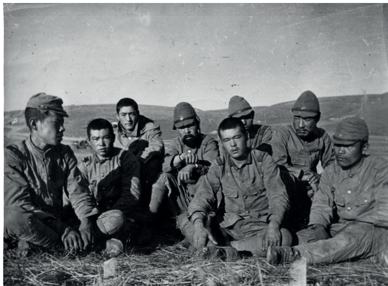
Военнопленные, сдавшиеся у высоты Баянцагаан