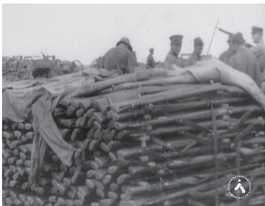
Фото № 8, 9. Кадры из документального фильма «Халхин-гол». Москва. 1940 г.