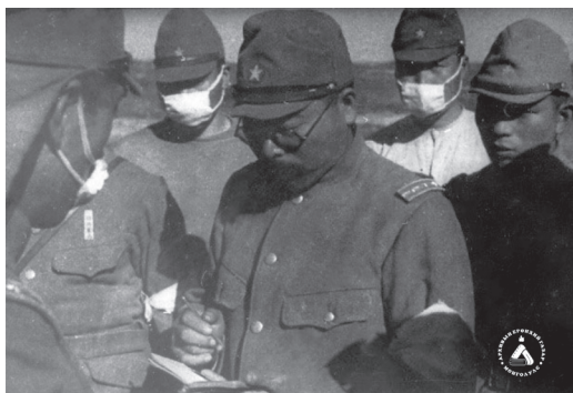
Фото № 5, 6. Кадры из документального фильма «Халхин-гол»

Для обсуждения предложенной процедуры японская комиссия взяла перерыв и через 40 мин. выразила свое согласие в том, что японские команды будут работать с 23 по 27 сентября 1939 г. ежедневно с 9 утра до 18 часов вечера и завершат работу в течение 5 суток, после чего передача трупов будет производиться по актам, назначенными лицами с обеих сторон. Со стороны советско-монгольской комиссии было внесено предложение собирать трупы убитых солдат на нейтральной полосе в течение 22–24 сентября силами безоружных команд с обеих сторон 12 , что приветствовалось японской комиссией. Следует заметить, что военные комиссии весьма чётко