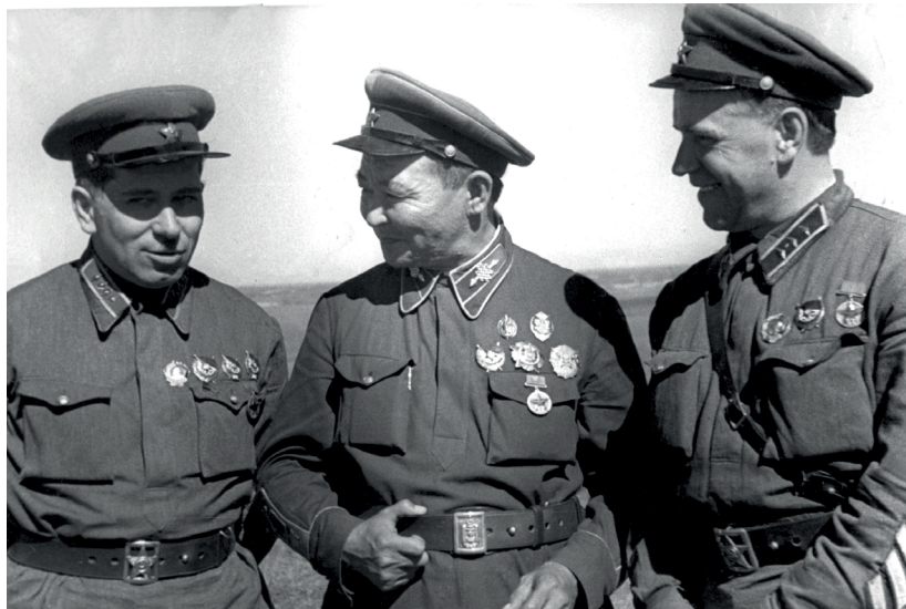
Г. М. Штерн, Х. Чойбалсан, Г. К. Жуков