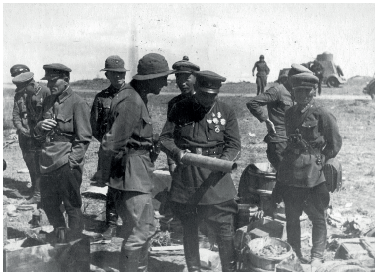
Командующий МНРА, маршал Х. Чойбалсан и его заместитель, корпусной комиссар Ж. Лхагвасүрэн осматривают трофеи