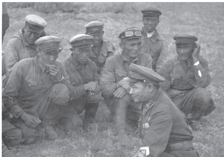
Маршал Х. Чойбалсан среди бойцов МНРА