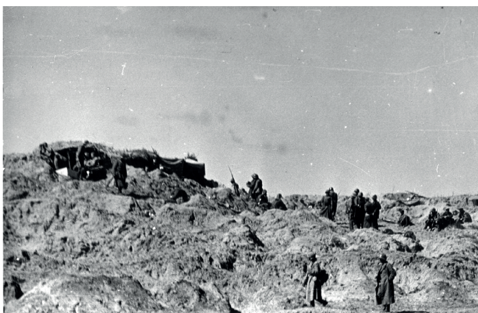
3 июля 1939 г. японцы форсировали Халхин-Гол в районе высоты Баянцагаан и в ходе ожесточенных боев 3–5 июля были окружены и уничтожены, а плацдарм ликвидирован. Высота Баянцагаан после разгрома японцев