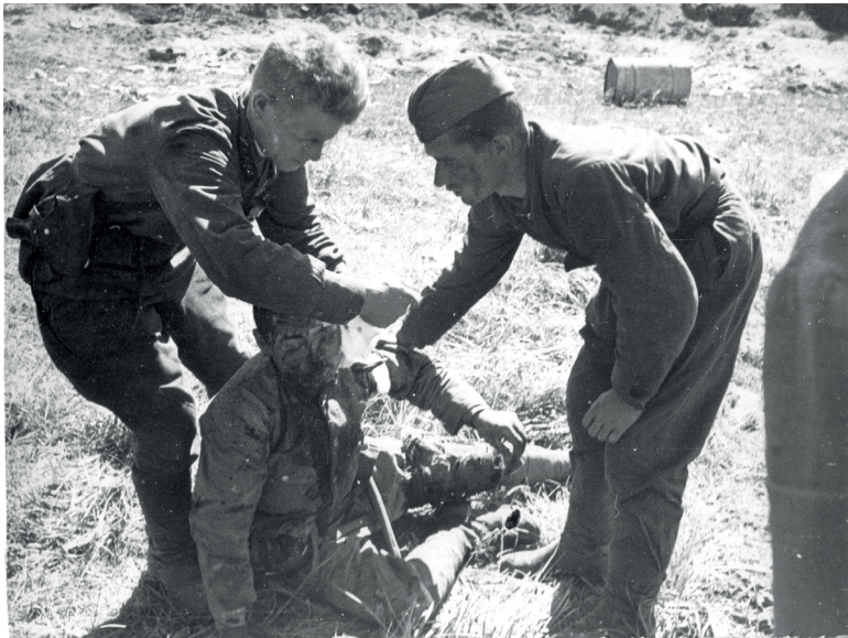
Оказание первой медицинской помощи раненому японскому солдату