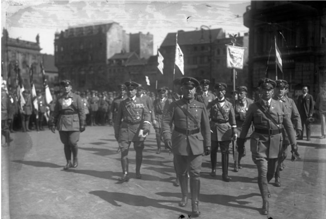
Руководитель Стального шлема (Stahlhelmführer) Дюстерберг выступает кандидатом на президентских выборах. Фотография сделана в феврале 1932 года