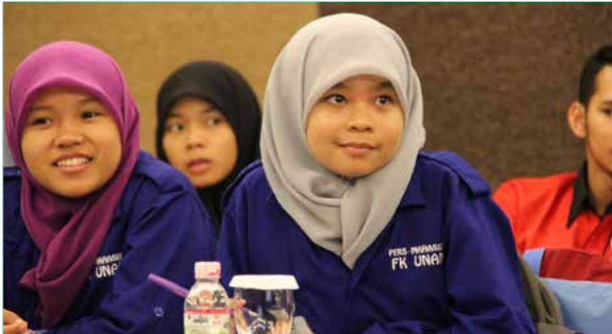
Mahasiswa mengikuti Workshop Jurnalistik Mahasiswa yang digelar Dewan Pers di Padang, 4 November 2014.

P ers mahasiswa dapat menjadi sarana yang konstruktif untuk membentuk sarjana berkarakter dan mempunyai kepribadian yang bertanggung jawab.