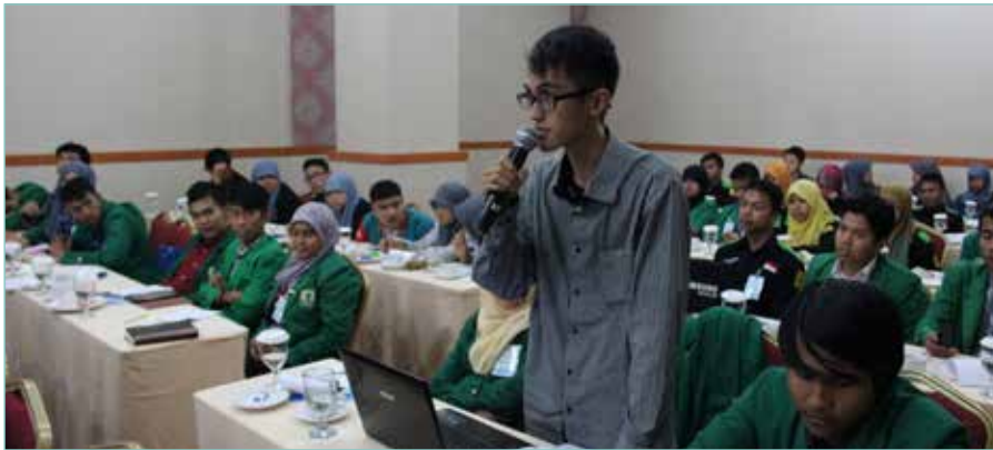
Seorang mahasiswa menyampaikan tanggapan saat mengikuti Workshop Jurnalistik Mahasiswa yang digelar Dewan Pers di Bukit Tinggi, 16 November 2014.

Ikatan Pers Mahasiswa Indonesia (IPMI) merupakan organisasi yang besar bahkan memiliki media cetak dan radio. IPMI ada di Bandung, Jakarta, Yogyakarta dan di beberapa tempat lainnya.