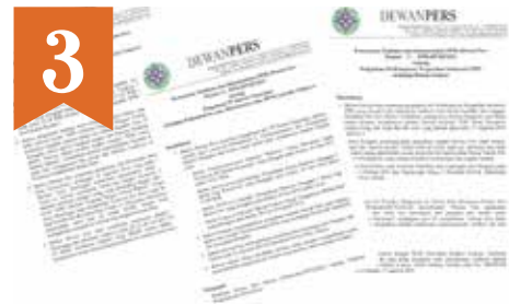
Dewan Pers Keluarkan Enam PPR