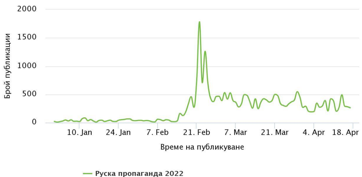
Графика 4: Брой пропагандни публикации на ден, съдържащи новите ключови думи (01.01 – 17.04.2022 г.)

Впрочем как се повишава пропагандната активност през тази година може да се покаже с друга графика, която показва честотата на употреба само на новите ключови думи, но не на годишна, а на дневна база: