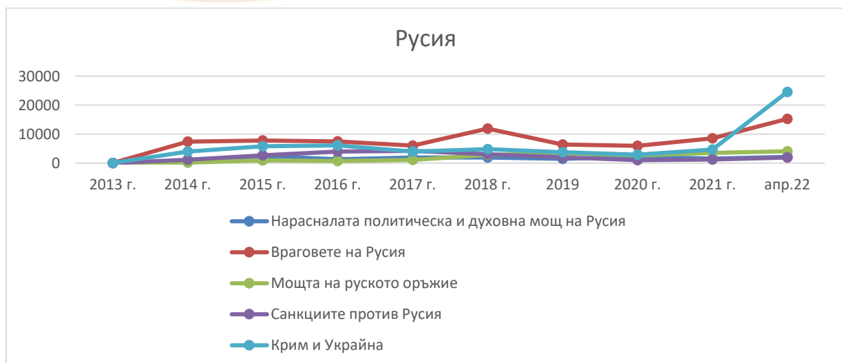
Графика 1. Руските наративи (2013-2022 г.)