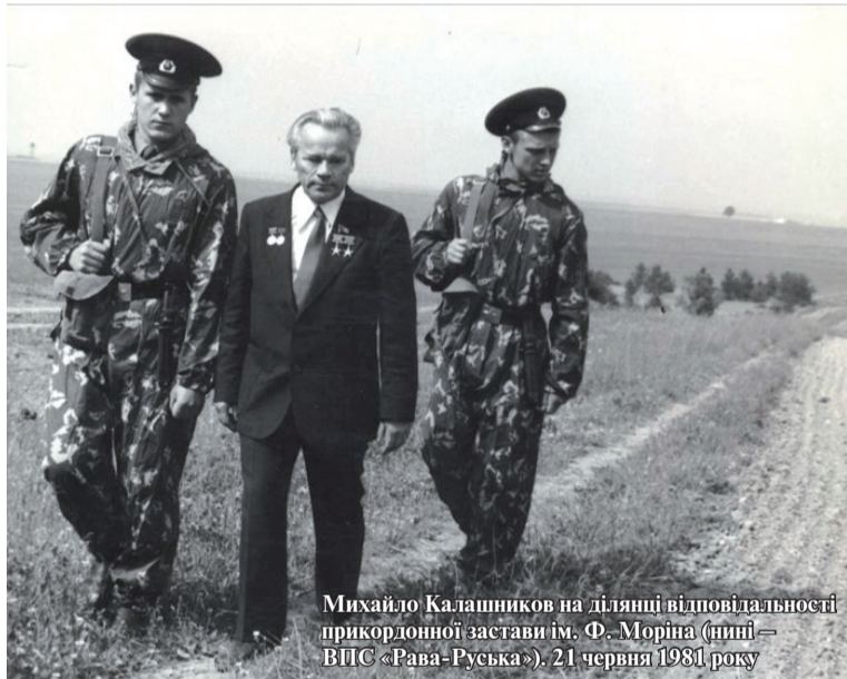
Михайло Калашников на ділянці відповідальності прикордонної застави ім. Ф. Моріна (нині – ВПС «Рава-Руська»), 21 червня 1981 року

Книга рекордів Гіннеса визнала автомат Калашникова наймасовішою зброєю на Землі. А вже АК офіційно стояв на озброєнні у 50 країнах. «Калаш» було виготовлено в різних модифікаціях (знову ж таки, лише за офіційним підрахунком) у кількості понад 70 мільйонів одиниць. Для порівняння, його головний конкурент – американська автоматична гвинтівка M16 потрапила до арсеналу лише 27 армій. Її тираж – 10 мільйонів штук.