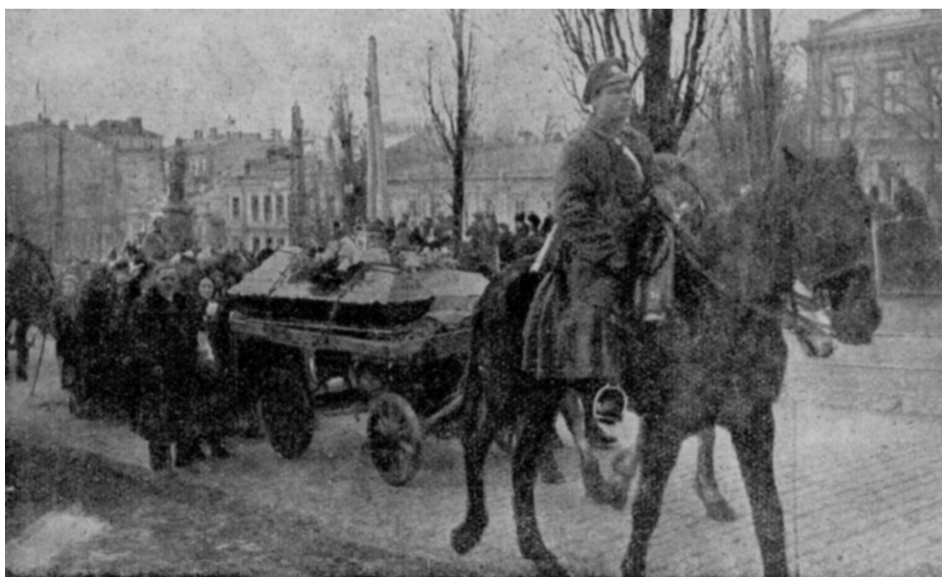
Поховання Героїв Крут. Київ, березень 1918 року

Особливо це актуально нині, коли українська нація у жертвній боротьбі на Сході країни відстоює її територіальну цілісність. ■