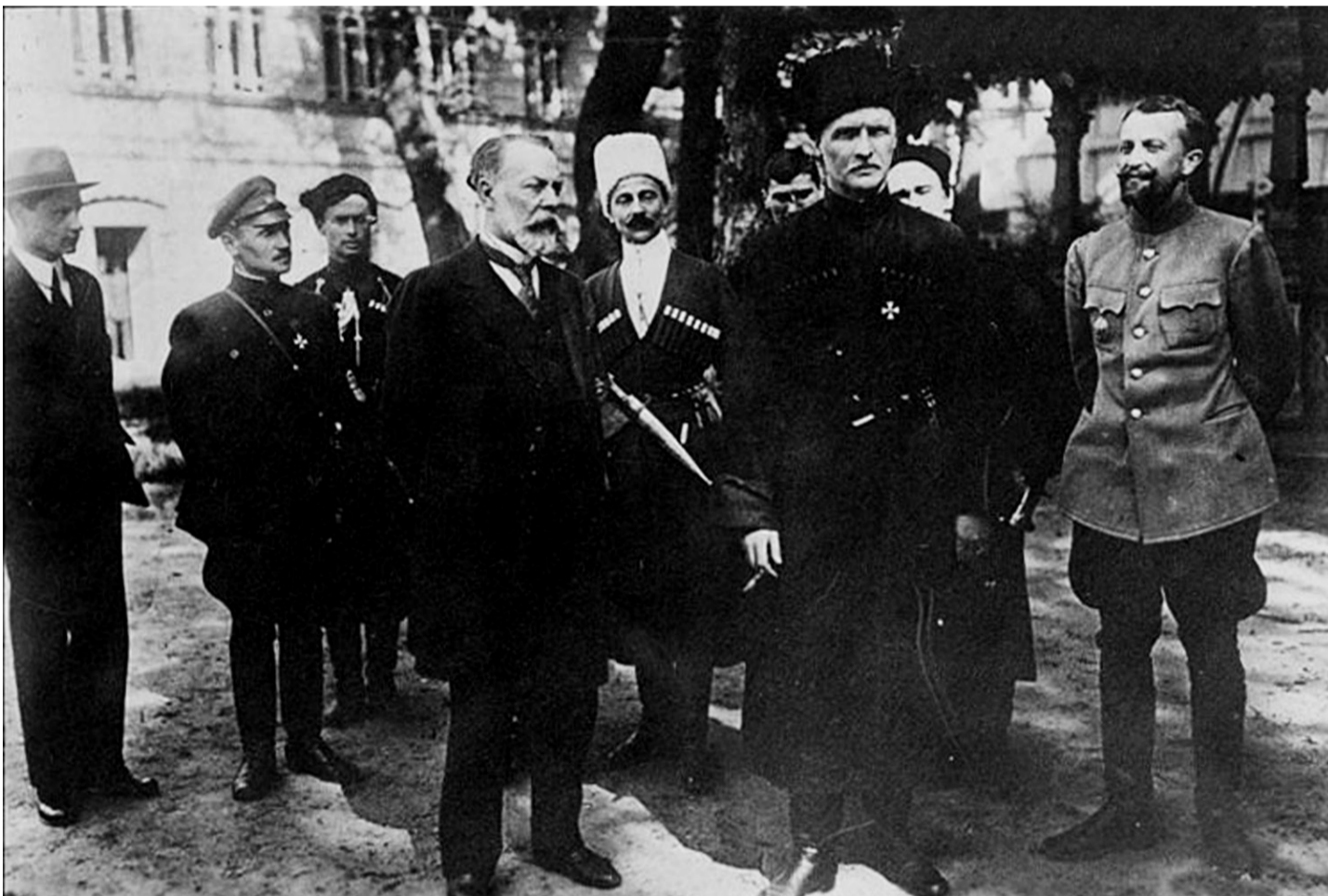
Скоропадський з міністрами

тільки смерть. Звідси і походила така незвична назва – підрозділи смерті. На бойових позиціях їх часто називали ще й ударниками.