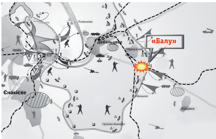
Мапа обстановки на Дебальцевському плацдармі станом на 10–17 лютого 2015 року

Штаб сектору, звичайно, був пріоритетною цілью бойовиків. Але на шляху до нього наче нездоланна фортеця стояв «Балу». На початку лютого свої корективи внесла матінка-природа. Через відлигу товстий шар снігу практично повністю розтанув, перетворивши поля на болотяне місиво. Нашим бійцям доводилося вичерпувати з напіврозбитого ворожим снарядом бльдажа до двох тонн води (40 бідонів) кожного дня, але болото в полях за межами асфальтованих доріг суттєво сковувало та обмежувало дії ворожої бронетехніки.