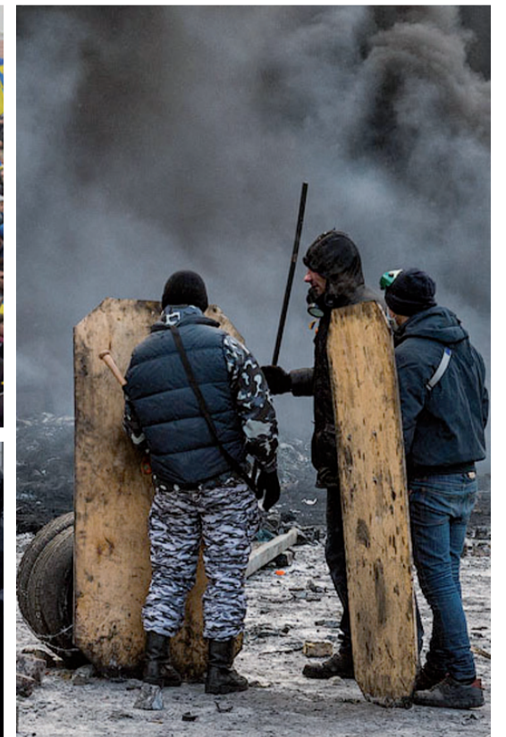
Шпальту підготував Андрій КУЧЕРОВ