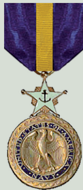
Медаль «За видатну службу» заснована Конгресом США 4 лютого 1919 року та вручається старшим офіцерам Флоту і Корпусу морської піхоти за виняткові заслуги при виконанні своїх обов'язків. До серпня 1943 року була другою після «Медалі Пошани» в загальній системі старшинства військових нагород США.

— Посол В. Стендлі згодом говорив, що він особисто хотів вручити нагороди радянським людям в урочистій обстановці, але його побажання не прийняли. В результаті 15 нагород було передано Міністерству закордонних справ СРСР. Їх вручали на місцях. Вільям Стендлі був дуже засмучений. Він багато писав про це в західній пресі, але нічого не читав про цих людей у радянських газетах, не чув по радіо. Тоді дипломат написав Президенту США, що він не зміг виконати свою місію, — розповідала дружина нового посла США в СРСР Джона Метлока під час її перебування в серпні 1989 року в Севастополі.