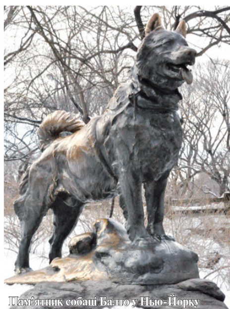
Пам'ятник собаці Балто у Нью-Йорку

Людство завжди віддавало шану собакам за їх тямущість, хоробрість і відданість. Аби хоч якось віддячити своїм чотирилапим поміщикам та увіковічити їх подвиги гомо сапієнс ще здавна нагороджували кудланів орденами, медалями, присвоювали їм військові звання та споруджували пам'ятники.