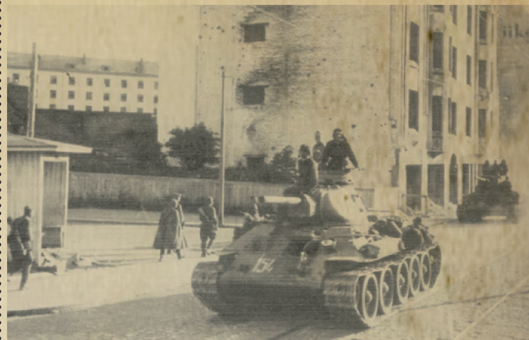
Советские танки проходят по улицам города.