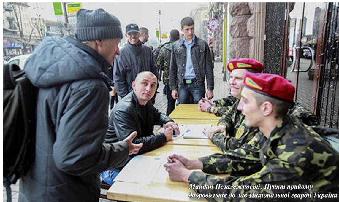
Майдан Незалежності. Пункт прийому добровольців до лав Національної гвардії України

13 березня нинішнього року вітчизняним Парламентом прийнято Закон «Про Національну гвардію України». Чим стане це військове формування — поверненням «старої» Нацгвардії чи новою формою існування Внутрішніх військ МВС?