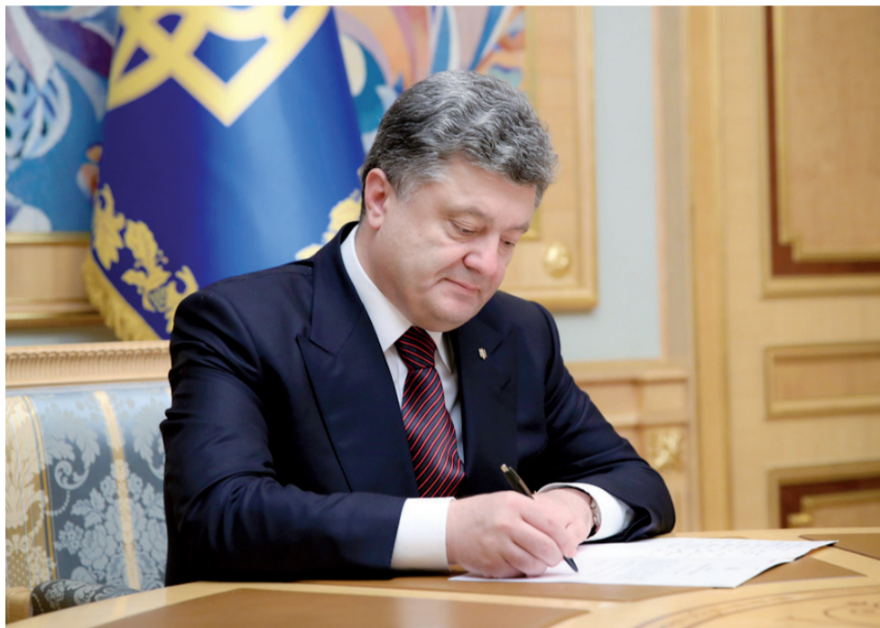
Президент Петро Порошенко підписав Указ, яким увів у дію рішення Ради національної безпеки і оборони від 4 березня «Про Концепцію розвитку сектору безпеки і оборони України».