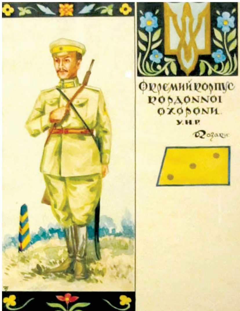
Уніформа вояка Окремого корпусу кордонної охорони зразка 1922 року