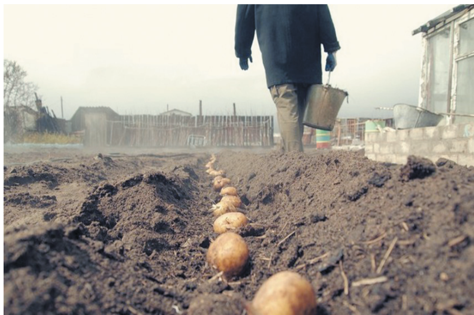
Шпальгу підготувала Світлана ДЕЙЧУК

Роками українці в День праці намагалися використати свято, щоб ще й картоплю посадити. Цього року початок травня рясніє вихідними, які для деякого стануть «картопляними канікулами». Здавалося б, що цікавого можна розповісти про картоплю? Звичайний собі овоч, який в Україні називають «другим хлібом». А чи знаєте ви, що в Європу картопля вперше потрапила 426 років тому? За однією із версій, у липні 1586 року англієць Томас Херріот привіз із Колумбії до себе на батьківщину першу бульбу. Англієць вважають, що саме вони першими спробували смак картоплі та зробили її надбанням європейської кухні.