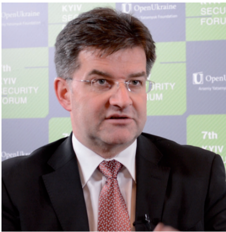
Мирослав ЛАЙЧАК, Вице-прем'єр-міністр – міністр закордонних справ Словаччини

– Пане Мирослав, довгий час Словаччина (у складі Чехословаччини) була членом Варшавської угоди. Коли Ваша країна вступала до НАТО як окрема самостійна держава, то як до цього поставилося суспільство?