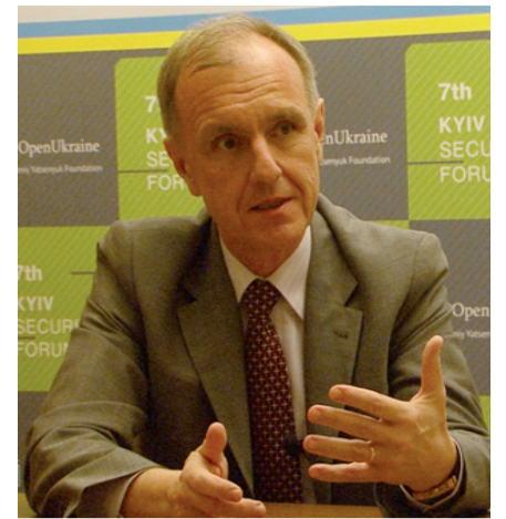
Богдан КЛІХ, міністр оборони Польщі 2007-2011 рр.

– Я розумію, що говорите про Україну. Я не є українським політиком, тому не буду радити нічого вашому Уряду. Ви – українці – самі краще знаєте, що слід робити. Однак, враховуючи досвід Польщі, починаючи з початку 90-их років, хочу сказати, що ми також перебували в цій сірій безпековій зоні у період з 1991 по 1999 роки. Без приєднання до Альянсу Польща зараз перебувала б у схожій ситуації, що й Україна. Наш досвід показує, що лише під захистом парасолі існуючих безпекових