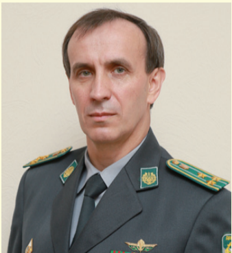
Водночас Південне регіональне управління очолив генерал-майор Володимир Плешко.