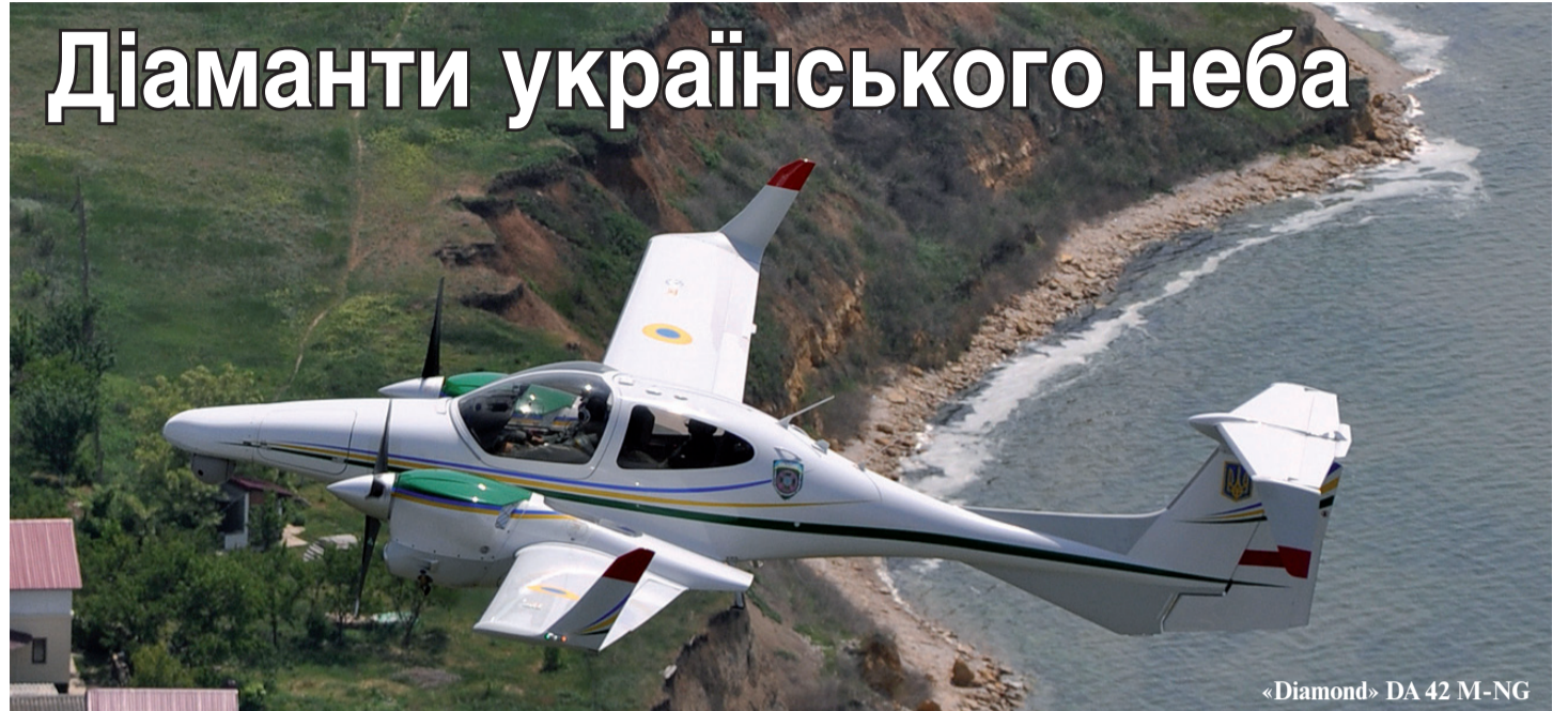
«Diamond» DA 42 M-NG

В українських прикордонників необхідність заміни старого авіапарку назріла вже давно. Пояснюється це багатьма причинами, зумовленими ефективністю використання вертольотів і літаків, їх ергономічністю та необхідністю скорочення паливних витрат. Поступове оновлення відомчої авіації заплановано до 2020 року. Однак усім охоронцям рубежу добре відомо, що «крилатими прикордонниками» вже тривалий час використовуються новітні легкі патрульні літаки «Diamond» DA 42 M-NG.