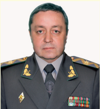
Бажаємо новопризначеним достойно проявити себе на цих відповідальних посадах, невичерпної енергії та наснаги!