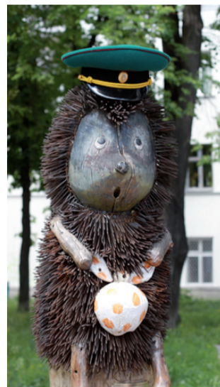
Уже не перший раз на День прикордонника розташований неподалік від будівлі Адміністрації Держприкордонслужби пам'ятник відомому мультперсонажу «Їжачку в тумані» одягають у зелений кашкет. Прізвали Їжачка на прикордонну службу і цього року.