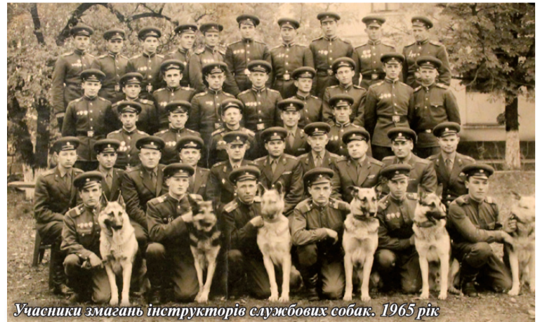
Учасники змагань інструкторів службових собак. 1965 рік