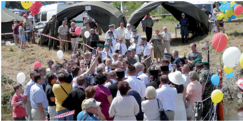
Увосьме на українсько-польському кордоні, біля прикордонного знаку 835, відбулися транскордонні Європейські Дні добросусідства.