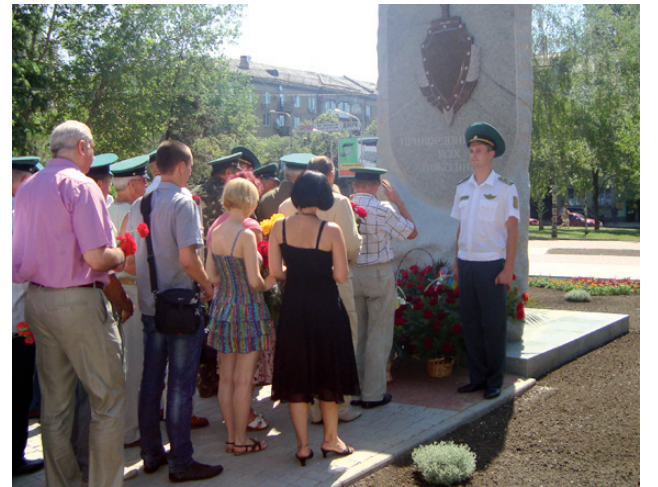
У День пам'яті і скорботи в Запоріжжі відкрито новий пам'ятник «Прикордонникам усіх часів».