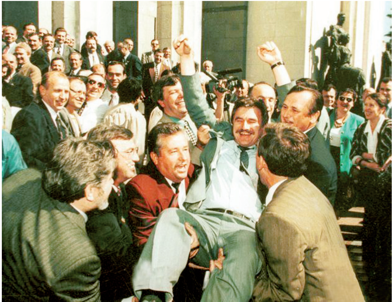
28 червня 1996 року. Після прийняття Конституції народні депутати підкидають одного з доповідачів проекту Основного закону Михайла Сироту

шті отримали відповідь на свої запитання. Хоча ми розуміємо, що найкраще не те, що проголошує, а те як працює Конституція на своїх громадян у сильній, економічно розвиненій країні, єдиній у прагненні кожного її громадянина будувати власне життя і держави загалом у строгій відповідності з Основним законом. Поки що нам, українцям, похвалитися нічим. Тож святкувати День Конституції будемо з вірою у краще майбутнє. ■