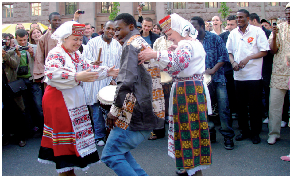
Африканець долучається до українського народного танцю в центрі Києва під час заходу, підтриманого МОМ. Підтримка культурної різноманітності належить до ключових пріоритетів Представництва МОМ в Україні.

– Через українські землі пролягає один з основних маршрутів. Утім ми спо-