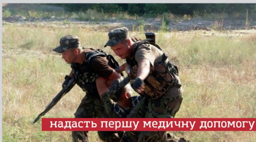
надать першу медичну допомогу