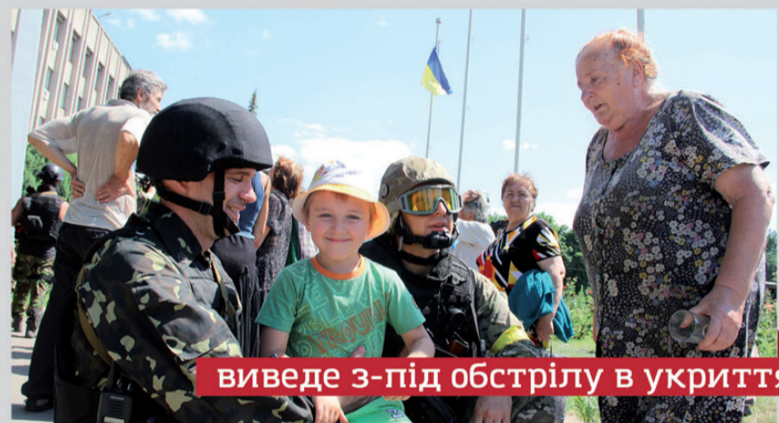
виведе з-під обстрілу в укриття