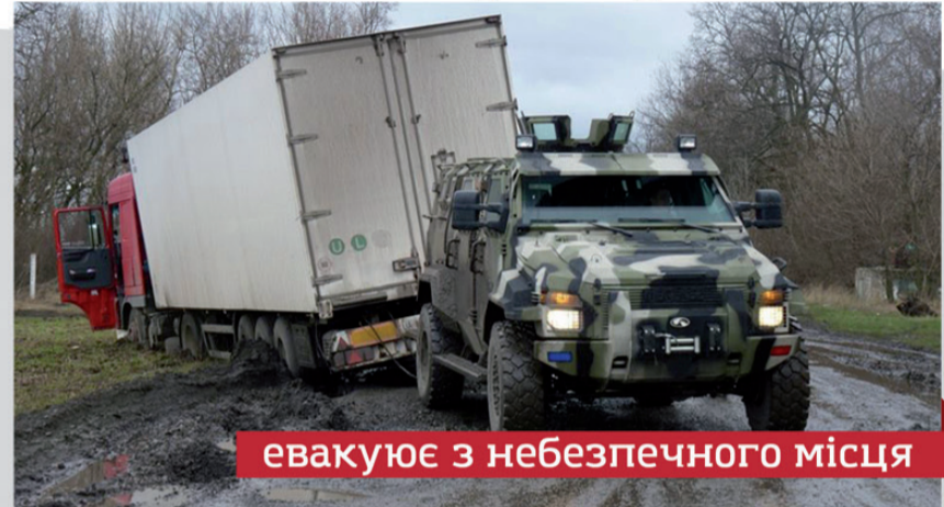
евакуує з небезпечного місця

Українські вартові рубежу – надійні та відповідальні захисники, на яких можна покластись у складній ситуації.