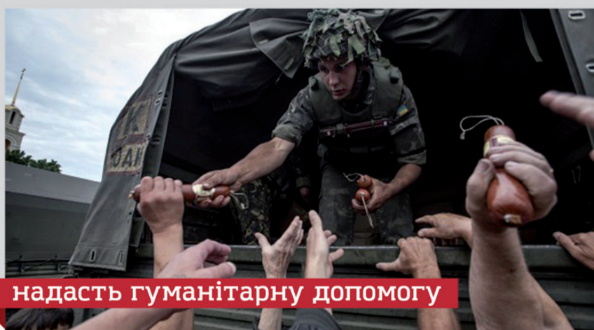
надать гуманітарну допомогу