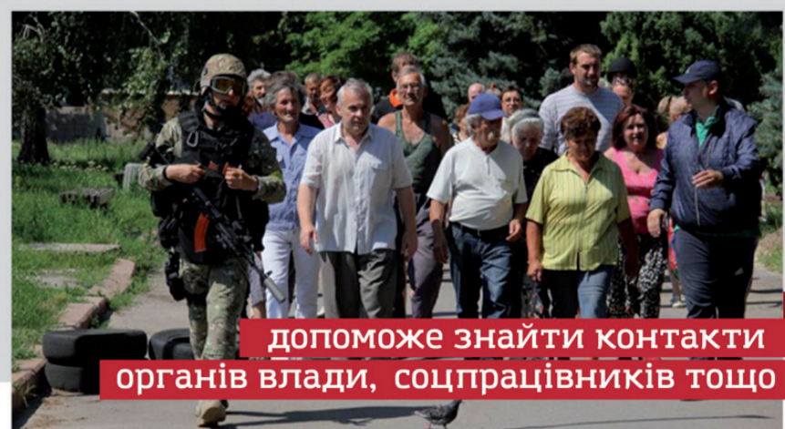
допоможе знайти контакти органів влади, соцпрацівників тощо