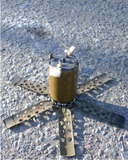
Російський боеприпас біля ВПС «Мілове». 08.08.2014

стілки, став уперто віддалятися від неї, збільшуючи кут. Поблизу стінки залишався тільки завіс і пружинка. І так до 90 градусів. Дві-три пластинки, зустрівши опором лише повітря, одразу зайняли потрібне положення. Дві-три інших – отримали більше навантаження, але саме вони підняли циліндр вертикально, під прямим кутом до землі. І всі шість тепер стали його основою.