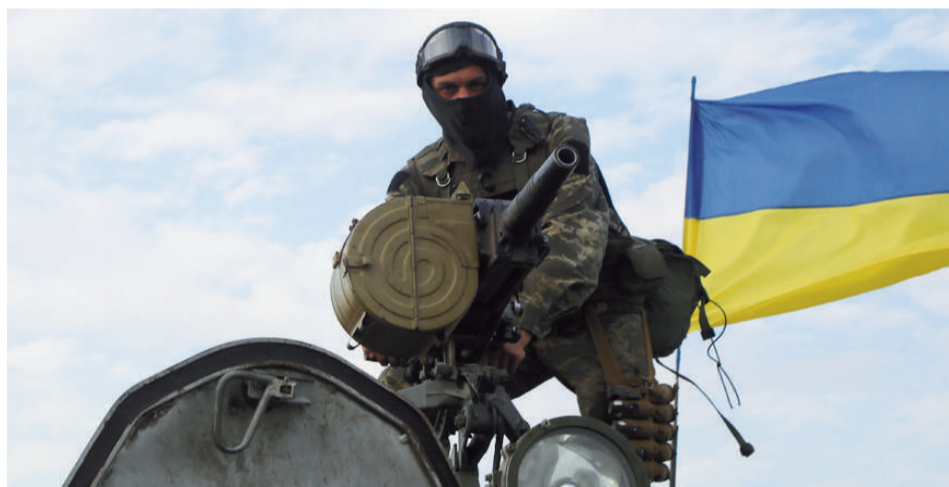
Надійшла команда «До бою!»