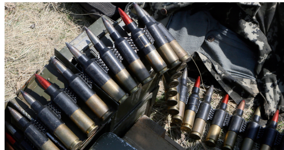
«Гостинці» для терористів