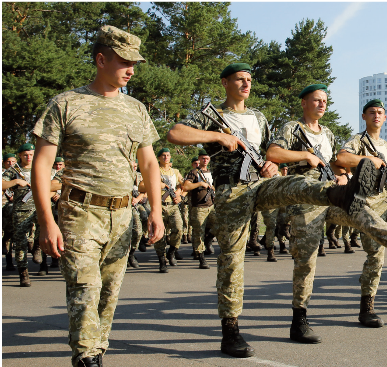
Тренування починається з розминки

Редакція газети звернулася до ректора Національної академії генерал-майора Олега Шинкарука з проханням прокоментувати процес цьогорічної підготовки курсантів навчального закладу до головного державного свята.