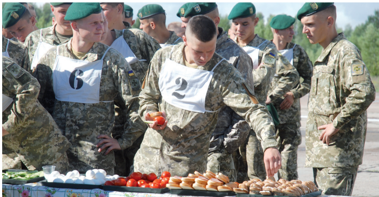
Ланч на злітній смузі

Необхідно окремо зауважити, що всі курсанти дуже вмотивовані. Під час підготовки до формування списків учасників було проведено конкурсний відбір на право участі у урочистостях з нагоди Дня Незалежності. Відібрали найкращих. У строю немає тих, хто має заборгованість по навчанню або зауваження по дисципліні. Перебуваючи поруч із підлеглими відчуваю загальний позитивний порив курсантів. Вони прагнуть стати на параді найкращими! ■