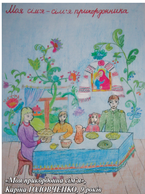
«Моя прикордонна сім'я», Каріна ГОЛОВЧЕНКО, 9 років