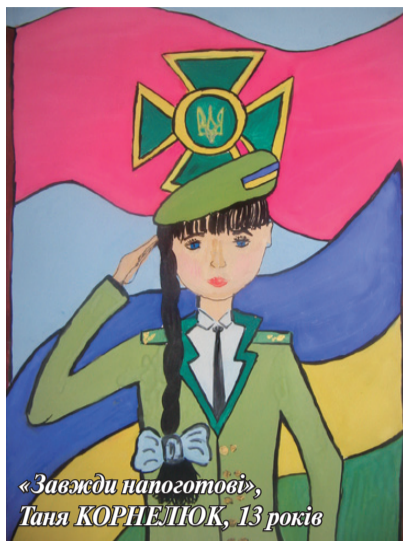
«Завжди напоготові», Таня КОРНЕЛЮК, 13 років