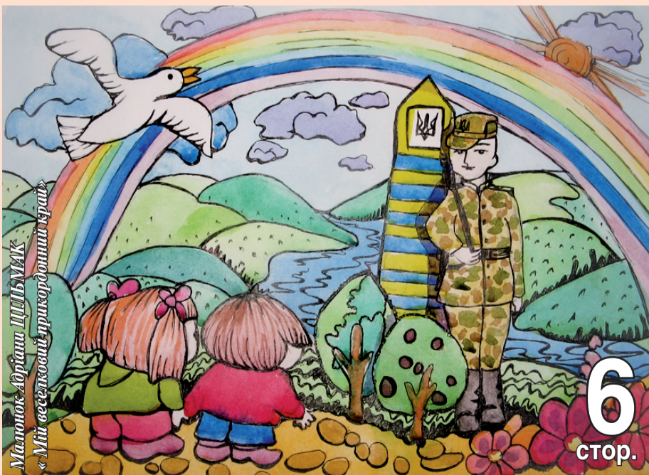
Малюнок Адріана ЦЕБІУКА «Мій веселивий прикордонний край»