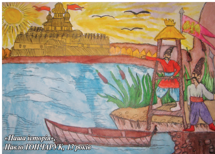
«Наша історія», Павло ГОНЧАРУК, 13 років