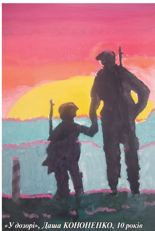
«У дозорі», Даша КОНОНЕНКО, 10 років