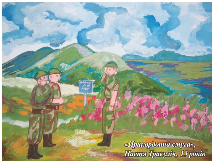
«Прикордонна смуга», Настя ТРИКУЛИЧ, 13 років