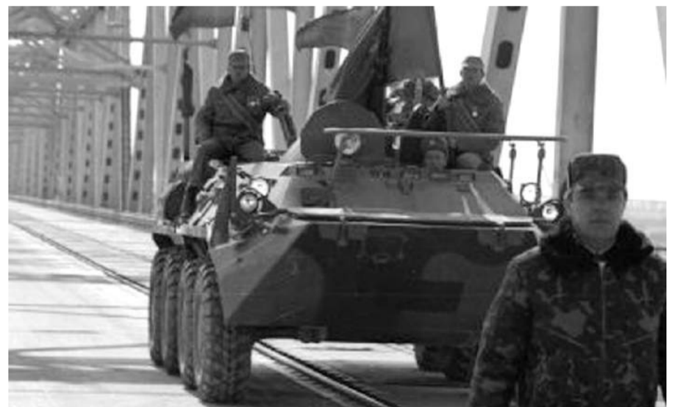
1989-й рік. Генерал Б.В. Громов іде по мосту попереду БТРа і за кілька хвилин виголошує історичну фразу, що за його спиною не залишилося жодного радянського солдата. Зліва на броні сидить той самий офіцер, який останнім перетнув державний кордон СРСР – В'ячеслав Купрієнко

– Це люди, котрі щодня своєю працею доводять, що недаремно живуть на цьому світі. Ті, хто обіймає сіньо-жовтий стяг не для папу. Ті, хто щодня під свистом кулі захищає державу. Саме заради таких людей і хочеться творити. Ви знаєте, мені не потрібні ані слава, ані чисть визнання, для мене зараз важливо – підтримати хлопців, які стоять на передовій. ■