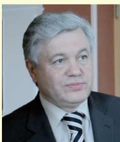
Олександр ЧАЛИЙ, перший заступник міністра закордонних справ України (1998 — 2001 та 2003 — 2004 років): — Україна — це невелика країна з точки зору

Наша країна знаходиться у дуже важливому геополітичному регіоні. Це є певною перевагою, проте додає складності у вибудовуванні власної зовнішньої політики. Адже доводиться враховувати інтереси багатьох потужних світових гравців. Відтак керівництво держави та дипломатичний корпус налагоджували відносини з багатьма країнами й організаціями з метою максимального відстоювання національних інтересів нашої держави. В свій час експерти навіть охрестили таку політику «багатовекторністю». Та завжди ці вектори підпорядковані одній меті — відстоюванню національних інтересів України, в тому числі підтримці на належному рівні її національної безпеки. ■