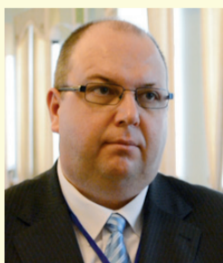
Марчін КОЖІЄЛ, Директор Офісу зв'язку НАТО в Україні:

сучасної геополітики, і в цьому контексті ключовими чинниками безпеки є не армія, не військова сила, а міжнародне право і міжнародні організації. Як позаблокова країна Україна тим більше повинна спиратися на ці дві фундаментальні речі безпеки.