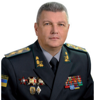
Голова Державної прикордонної служби України генерал-лейтенант НАЗАРЕНКО Віктор Олександрович

Президент України Петро ПОРОШЕНКО 23 жовтня 2014 року