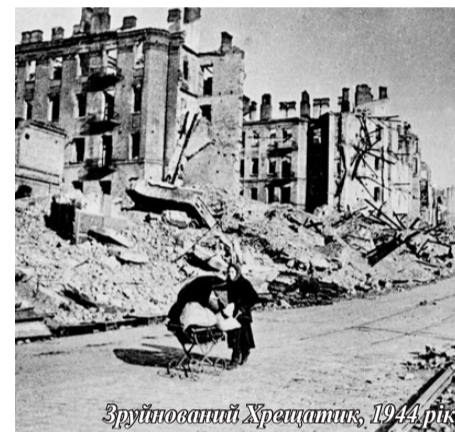
Зруйнований Хрещатик, 1944 рік

У лавах Радянської армії воювало понад 7 мільйонів українців. Кожен другий із них загинув на фронті, кожен другий із тих, хто залишився живим, став на все життя інвалідом. Українці склали в Радянській армії другу за чисельністю національну групу. Серед вищих офіцерів, зокрема командуючих фронтів і армій, було чимало українців. Найвідоміші з них – Андрій Єрьоменко, Семен Тимошенко, Родіон Малиновський, Микола Ватутін, Іван Черняхівський, Павло Рибалко, Кирило Москаленко та Пилип Жмаченко.