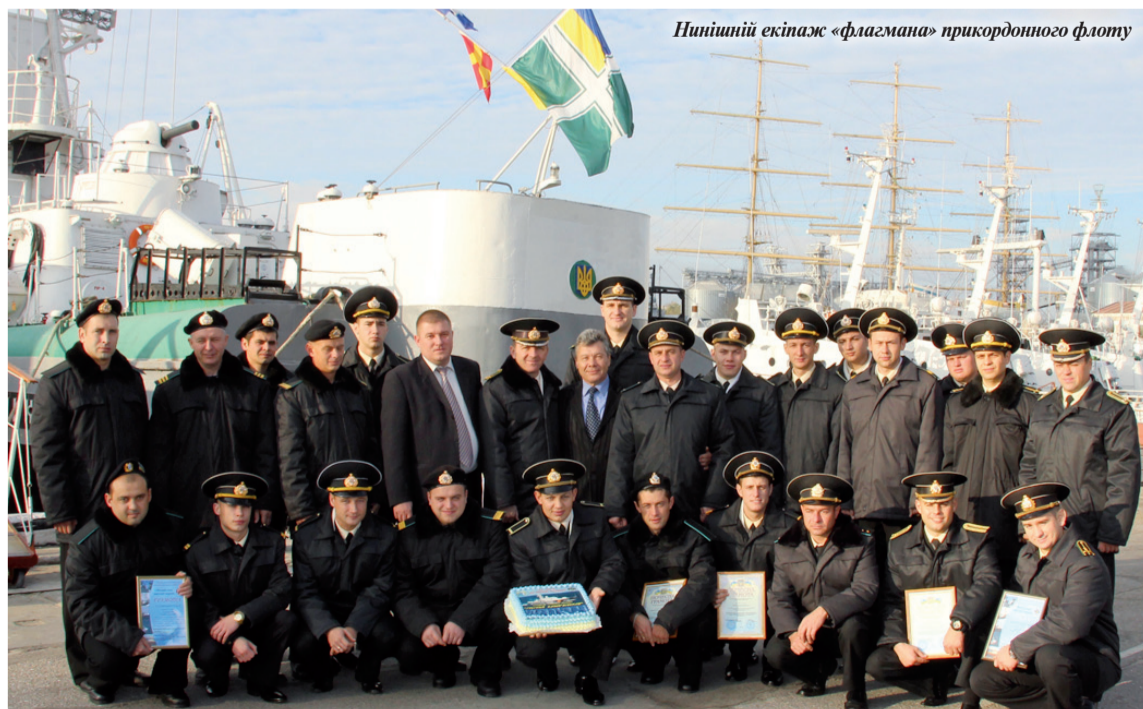
Нинішній екіпаж «флагмана» прикордонного флоту

Отже, легендарний ювіляр-флагман, попри поважний, як для військового корабля, вік має енергійний, молодий, освічений, перспективний екіпаж, здатний зберегти й примножити славні традиції, вписавши у історію нові героїчні сторінки. ■