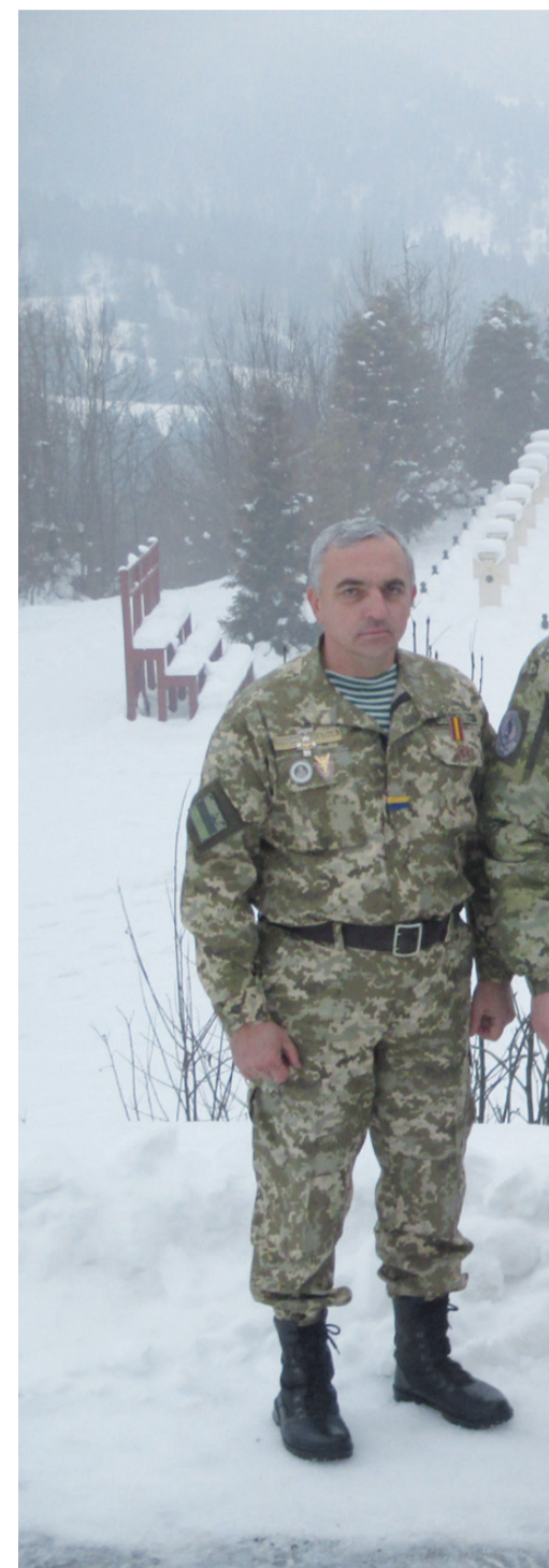
Зліва направо: селищний голова Славська

– Ми привезли свою найдорожчу реліквію, наш справді бойовий прапор сюди, де спочи-