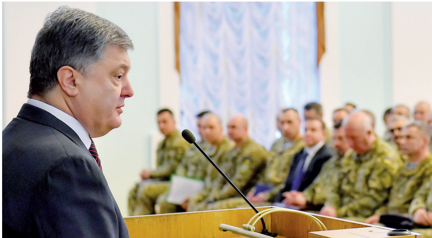
Виступ Президента України Петра Порошенка на оперативному зборі керівного складу Збройних Сил України