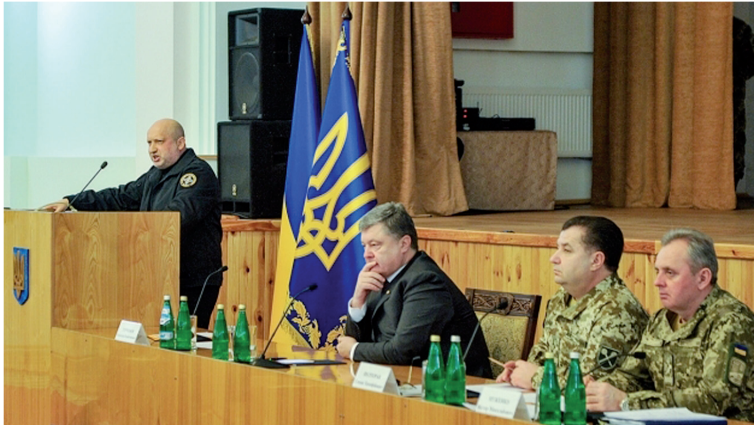
Виступ Секретаря Ради національної безпеки і оборони України Олександра Турчинова на оперативному зборі керівного складу Збройних Сил України