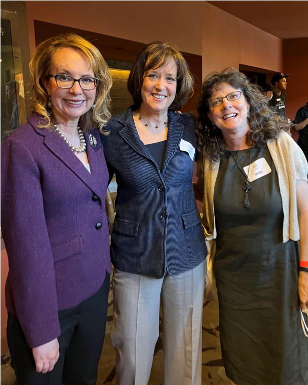
Fotografía de Gabby Giffords con los directores de cine Betsy West y Julie Cohen

Gabby Giffords No Se Rendirá es una película impactante que da espacio para que la audiencia pueda examinar el fenómeno de la violencia con armas de fuego en los Estados Unidos y lidiar con las difíciles emociones elevadas por esta realidad. La organización de prevención en contra de la violencia con armas de fuego fundada por Gabby, Giffords , nota que la palabra “sobreviviente” se refiere a cualquier persona que haya sufrido un cambio irreparable en su vida debido a la violencia con armas de fuego. Esto incluye a personas que han sido testigos a un acto de violencia con armas de fuego, o que alguien que conozcan o por quien se preocupan haya sido herido o asesinado, o que han sido amenazados o heridos con una pistola.