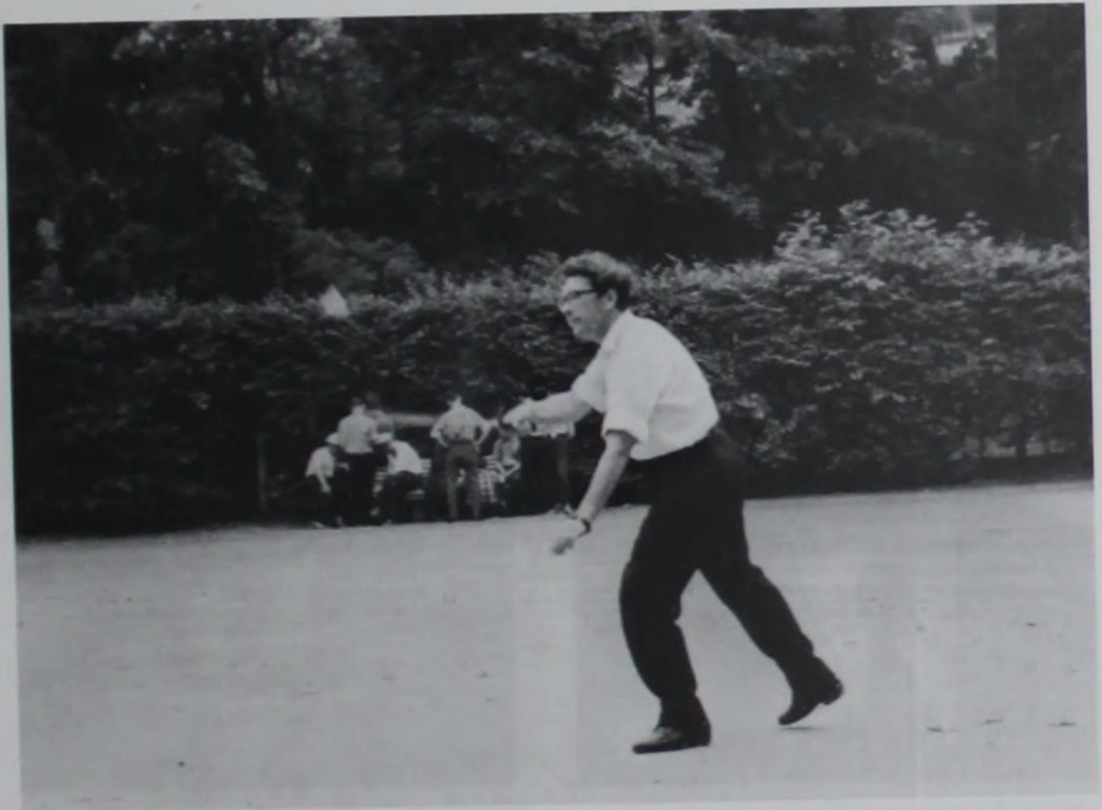
1965 г. За игрой в бадминтон.