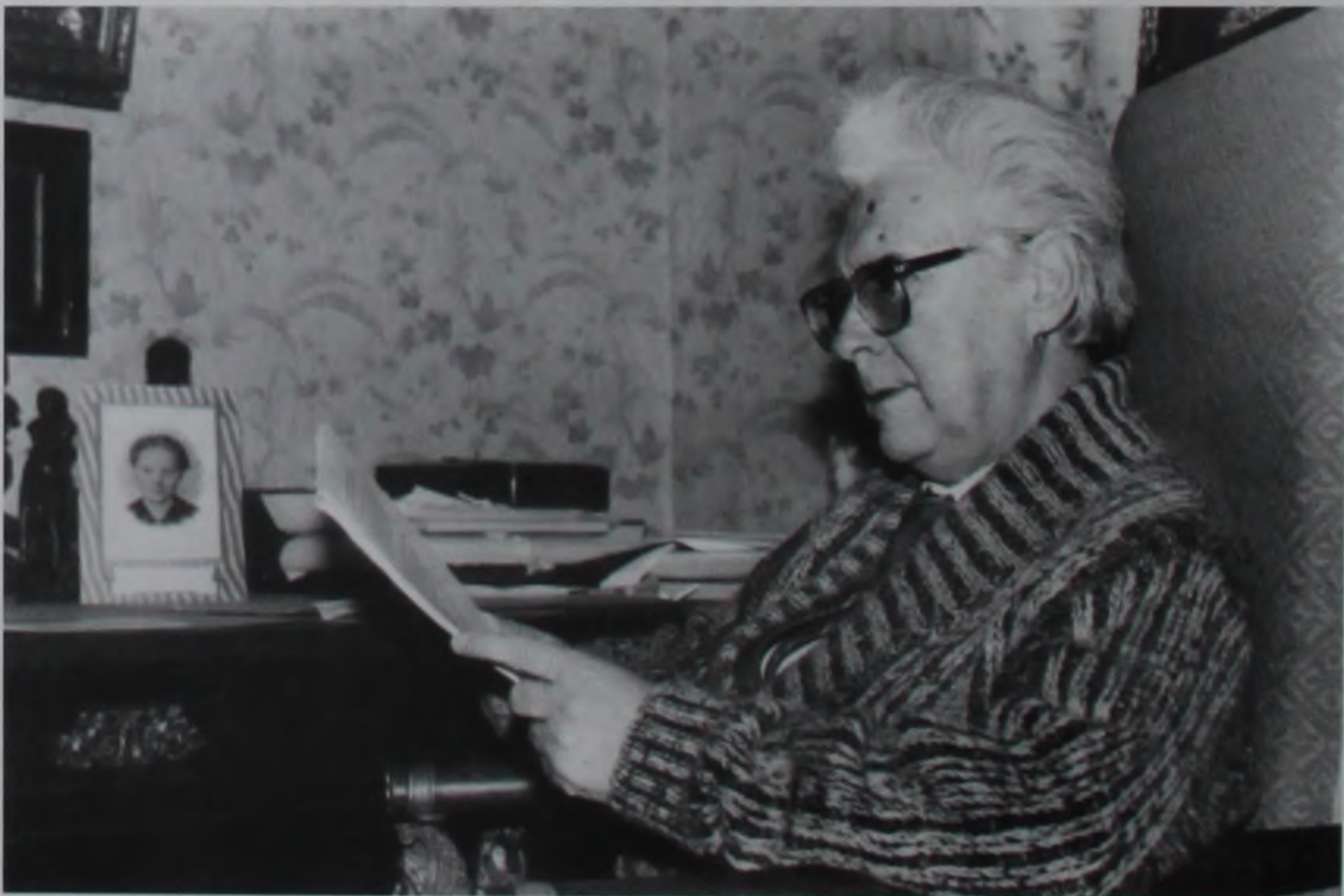
В рабочем кабинете. Конец 1990-х гг.