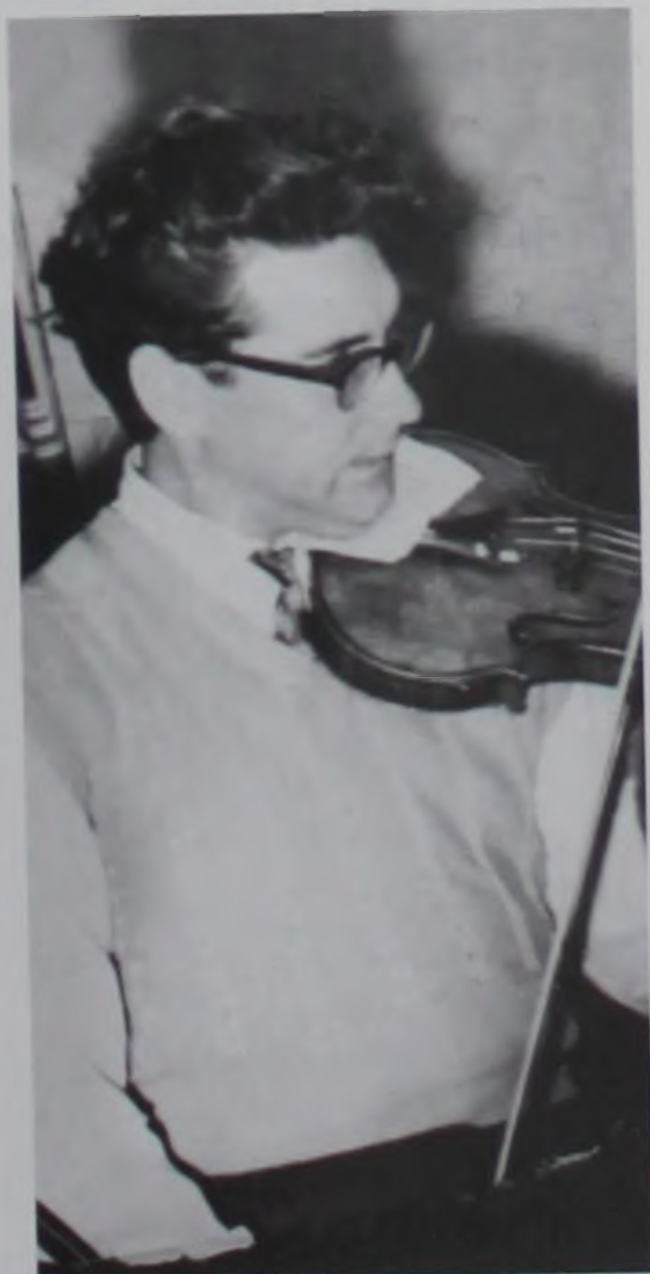
Ученый играет на скрипке.