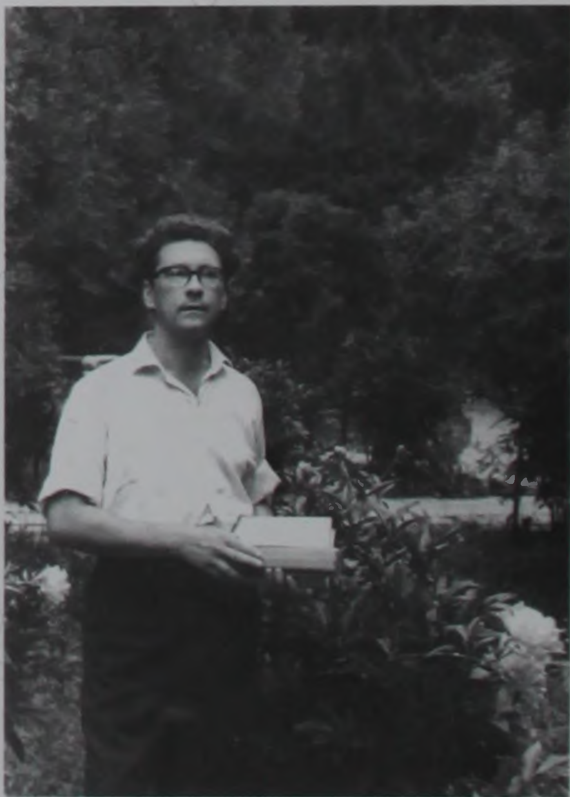
Р. Г. Скрынников в годы создания исследования об опричнине Ивана Грозного.