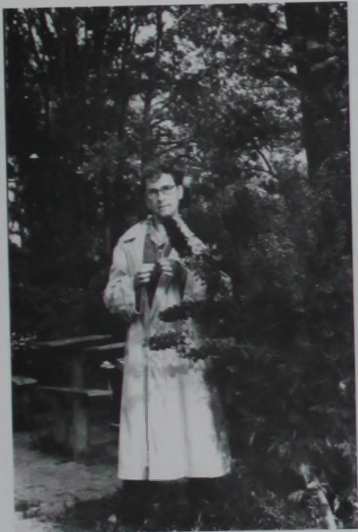
Ученый нигде не расставался с книгой.