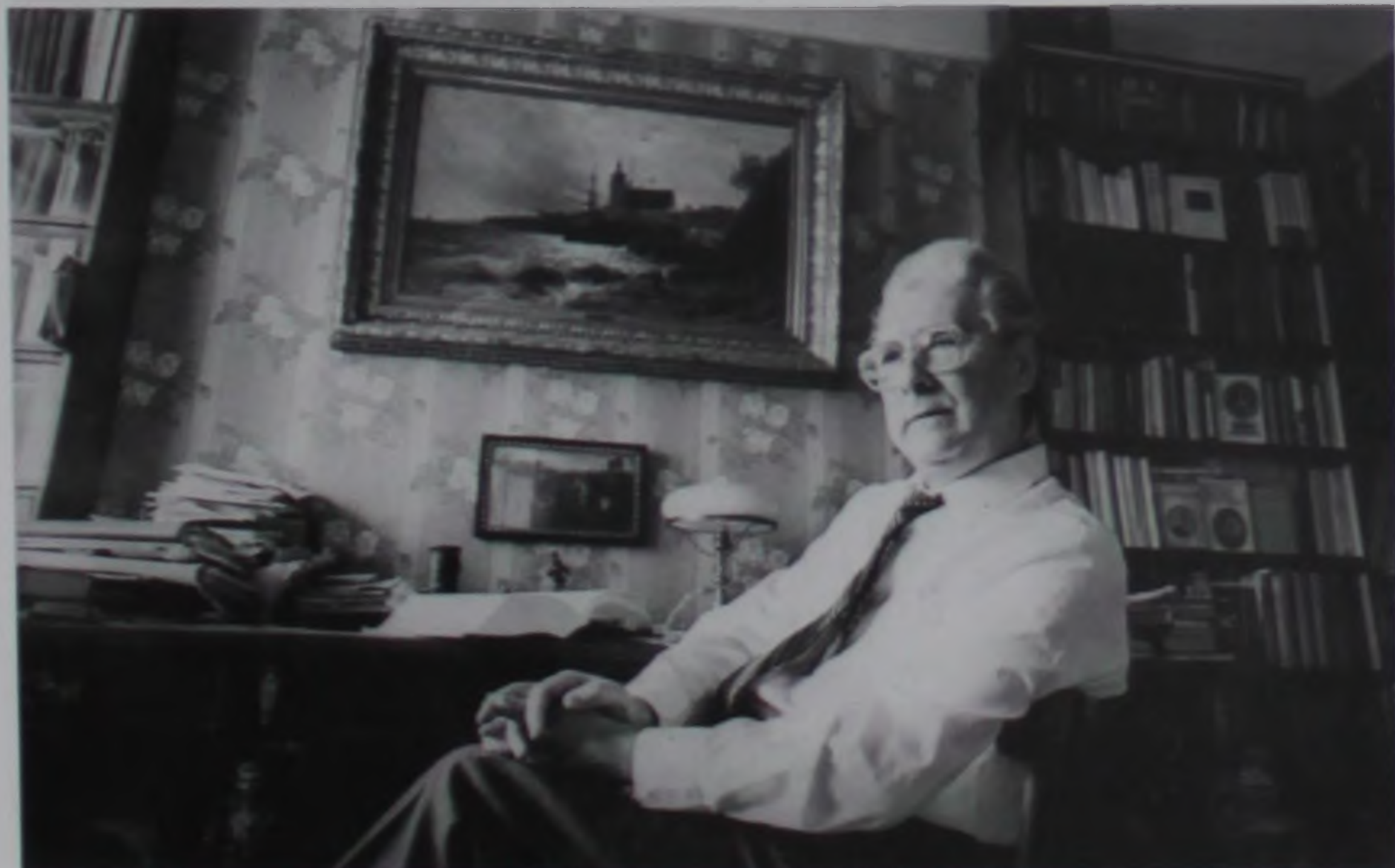
Р. Г. Скрынников в рабочем кабинете ученого. Конец 1980-х гг.