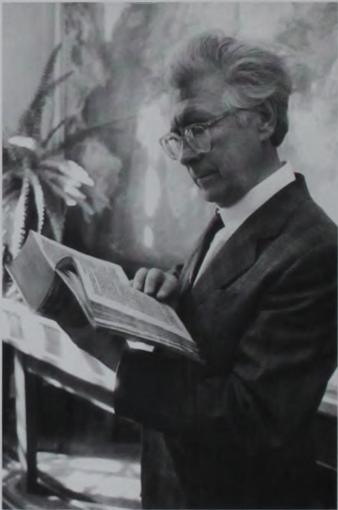
В Библиотеке Академии наук. Начало 1990-х гг.