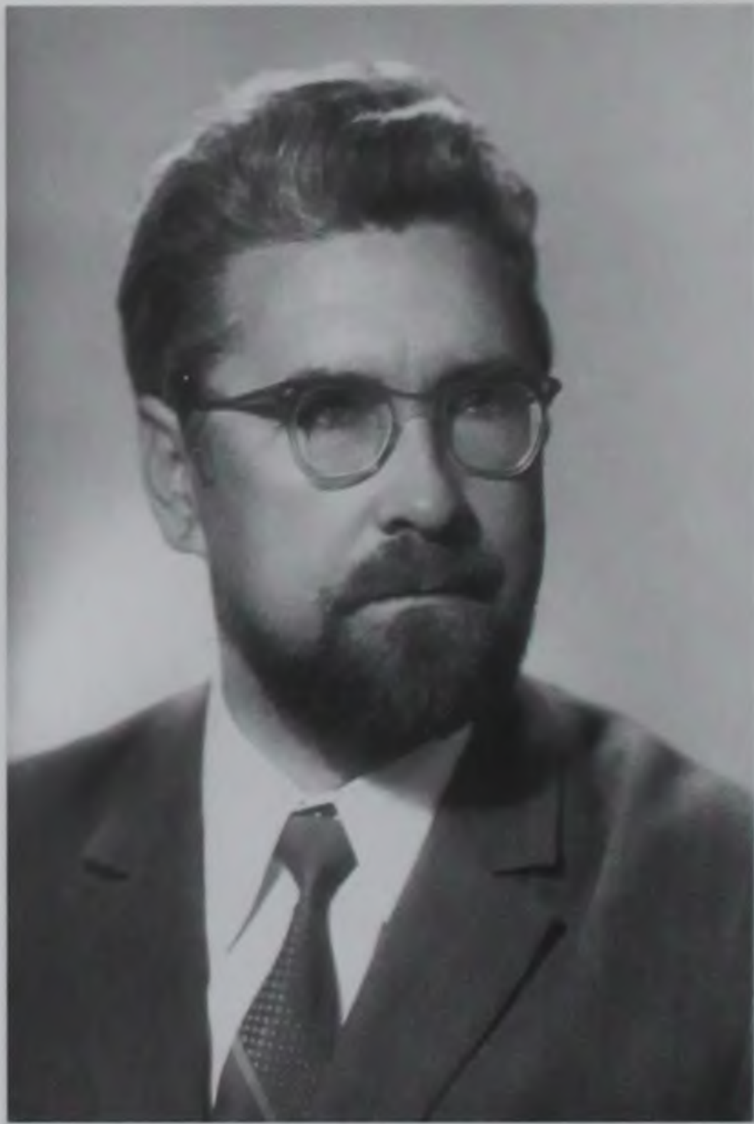
1974 г. Во время работы над «Иваном Грозным».