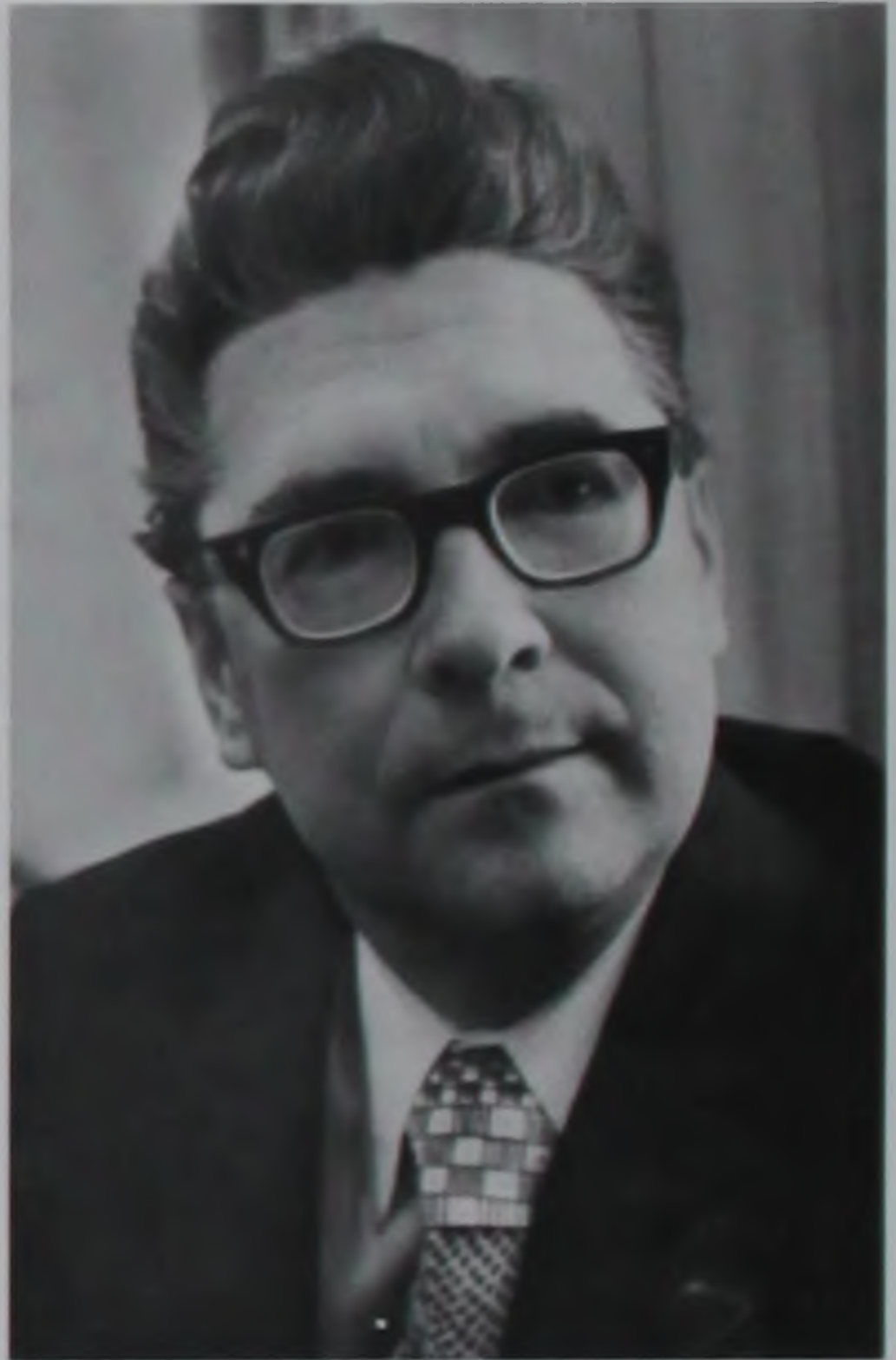
В начале 1980-х гг.