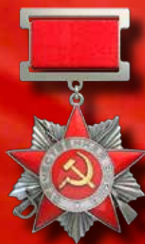
Ордена Отечественной войны II степени (1944, 1985)