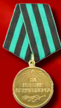
Медаль «За взятие Кенигсберга» (1945)