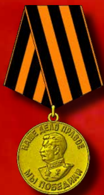
Медаль «За победу над Герма- нией в Великой Отечественной войне 1941–1945 гг.» (1945)