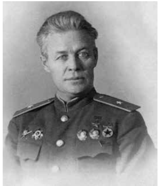
В.С. Молоков, Герой Советского Союза, генерал-майор авиации