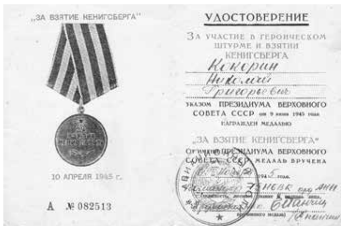
Удостоверение к медали «За взятие Кенигсберга», 1945 г.