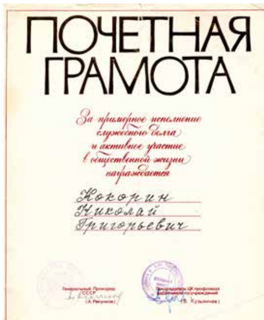
Почетная грамота Генерального прокурора СССР А.М. Рекунова, 1982 г.