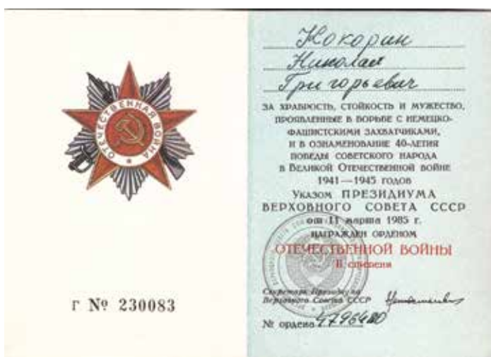
Удостоверение к ордену Отечественной войны II степени, 1985 г.