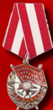
Орден Красного Знамени (1945)