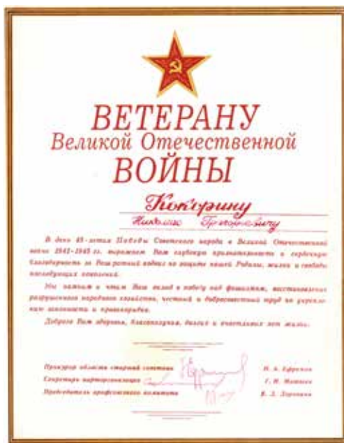
Поздравление прокурора Кировской области Н.А. Ефремова, 1990 г.