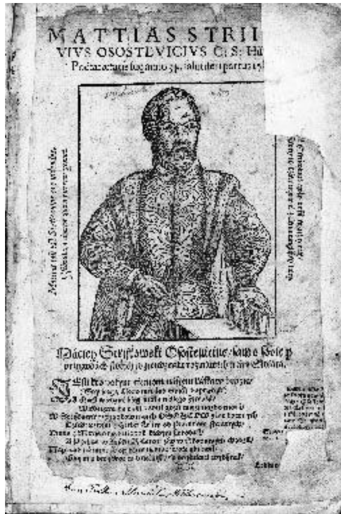
Иллюстрация 1. Портрет Мацея Стрыйкоўскага ў кенігсбергскім выданні “Хроніцы Польшчы, Літвы, Жамойці і ўсёй Русі” (1582). Змяшчэнне аўтарамі ўласных партрэтаў у сваіх выданнях – рыса рэнесанснай культуры

гістарыёграфу – з аднаго боку, як піша Альбіна Семянчук, адзначаюцца ягоная эрудыцыя і навізна падыходаў да матэрыялу; з іншага боку, яго дакаралі ў кампілятыўнасці, схільнасці да містыфікацыяў і проста ў заблытванні некаторых фактаў. Менавіта гэты твор ацэньваецца як удалая кампіляцыя іншых хронік, найперш Яна Длугаша і Мацея Мехавіты. Але, аб’ектыўна, Мацей Стрыйкоўскі выканаў для Вялікага Княства Літоўскага працу вартую той, што ў свой час зрабіў Ян Длугаш для Польшчы [30, с. 69].