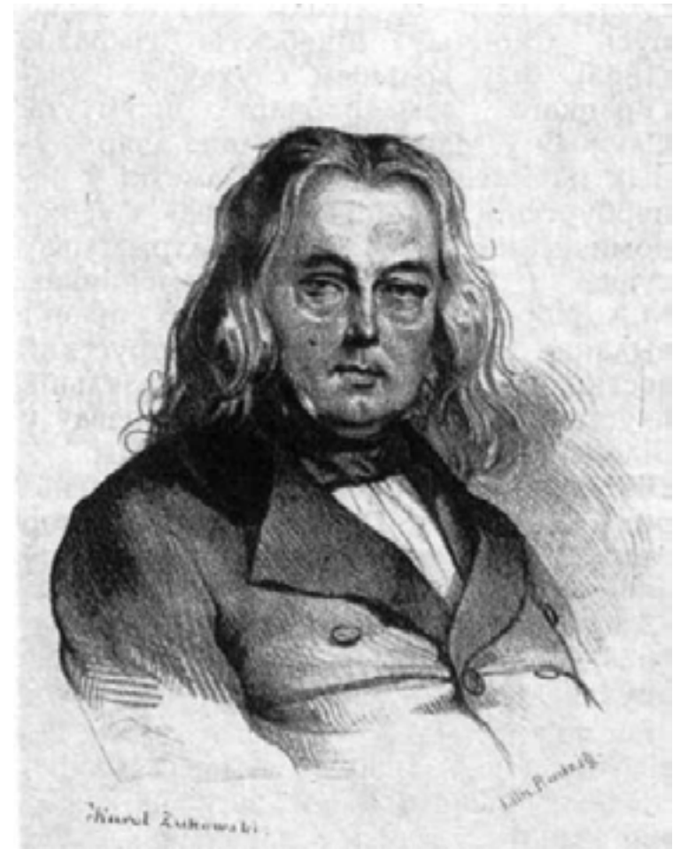
Ілюстрацыя 2. Ігнат Жэгота Анацэвіч. Партрэт выкананы В. Радзігам паводле малюнка К. Жукоўскага. Апублікаваны пасля смерці Анацэвіча ў пецярбургскім выданні “Rocznik Literacki” (1846, Т. 3). Як пішуць С. Габрусевіч і С. Марозава: “Перад намі фізічна моцны чалавек. Гэтая моц ірвецца вонкі так, што яе з вялікай цяжкасцю ўтрымлівае верхні гузік сурдута. Твар прыгожы і разумны, у поглядзе адкрытасць і цвёрдасць”.

Пасля ад'езду ў 1818 г. вядомага віленскага гісторыка Іаахіма Лялевеля (1786–1861) у Варшаву, Анацэвіч быў запрошаны заняць ягонае месца ва ўніверсітэце, дзе ён і служыў па 1828 г., спачатку як ад'юнкт (асістэнт прафесара), а з 1827 г. як прафесар. Паводле штатнай пасады Ігнат Анацэвіч выкладаў усеагульную гісторыю, але найбольшую славу прынес гісторыку ўпершыню ўведзены і чытаны ім бясплатна курс гісторыі Літвы. У далейшым некаторыя свае погляды на гісторыю Вялікага Княства Літоўскага Ігнат Анацэвіч выклаў у суправаджальных тэкстах [43, с. I–XXI] у падрыхтаваных ім да выданняў працах польскага гісторыка і езуіта Яна Альбертрандзі (1731–1808), бібліятэкара і архівіста караля Станіслава Аўгуста Панятоўскага. У 1820-х гг. Анацэвіч апублікаваў два маштабныя творы Альбертрандзі – па перыядах каралевання Генрыха Валуа і Стэфана Баторыя [37], а таксама Казіміра Ягелончыка, Яна Альбрэхта і Аляксандра Ягелончыка [38]. Для гэтага выдавецкага праекта рукапісы Альбертрандзі Віленскі ўніверсітэт часткова атрымаў задарма, а часткова набыў [10, с. 181].