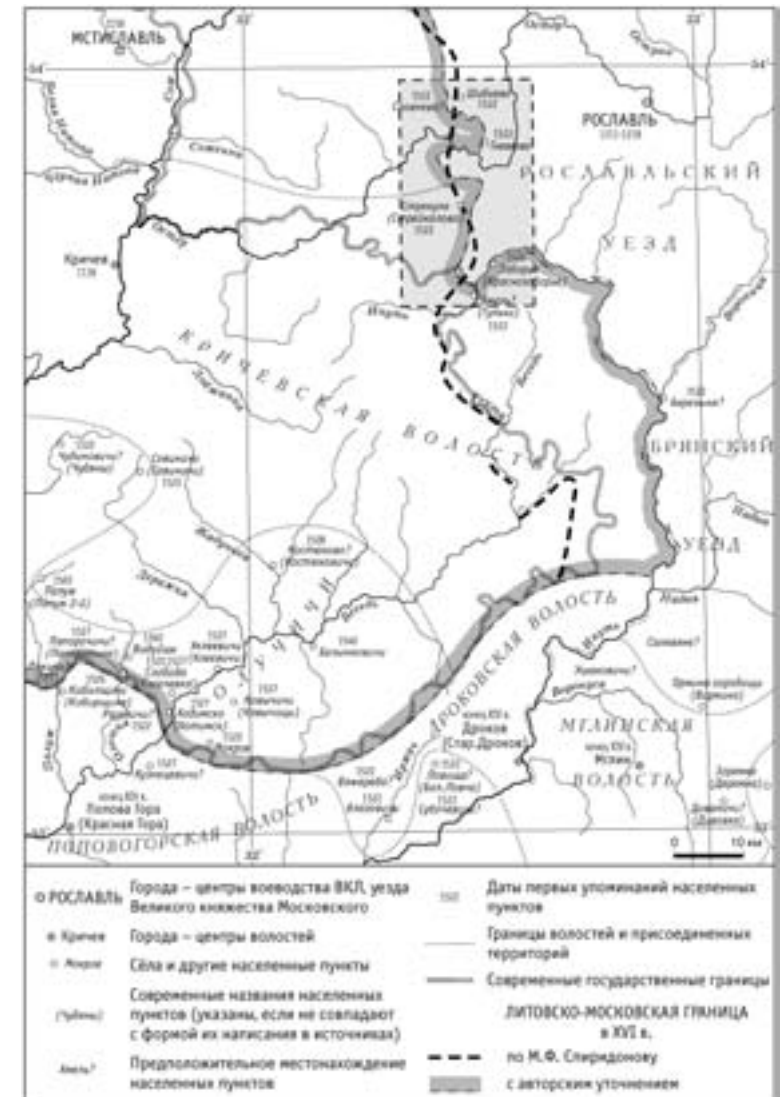
Карта 1. Кричевский участок литовско-московской границы