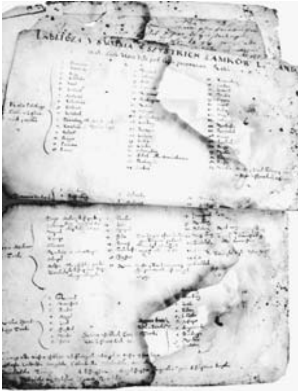
Ілюстрацыя 5. “Табліца і сума ўсіх замкаў інфляцыйкіх” са “Зборніка Стрыйкоўскага” (Пушкінскі Дом, Калекцыя Анацэвіча, X. 33, арк. 4–5).

не чытаемы” [34, с. 344]. У 2008 г. Альбіна Семянчук агучыла на канферэнцыі, прысвечанай Ігнату Анацэвічу, а і потым апублікавала даволі падрабязны агляд калекцыі Анацэвіча, базуючыся на катало-зе Каліноўскага і рэканструкцыі Пагарэцкага [31, с. 45–57].