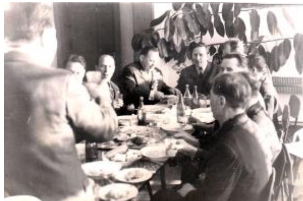
Встречи в Коломинских Гривах