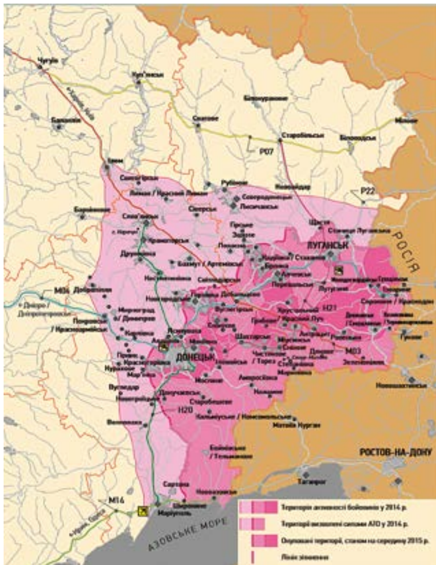
Карта військово-політичної ситуації на Донбасі 2014 – 2015 рр.

Як відзначив журналіст «The New York Times» Ендрю Рот, раптовий вибух проросійських демонстрацій в 11 містах України, де проживала значна частка етнічних росіян, очевидна організованість демонстраторів, поява російських громадян і повідомлення про повні автобуси активістів, які прибували з Росії, свідчили про високий ступінь координації з офіційною Москвою. 3 березня Донецька міська рада ухвалила рішення про проведення референдуму щодо розширеної автономії Донбасу, який український уряд назвав незаконним 1 . Міліція Донецька вжила контрзаходів 6 березня, затримавши в будівлі облдержадміністрації понад 70 протестувальників. Одночасно Служба безпеки України заарештувала П. Губарева і відвезла на допити до Києва. Після його арешту проросійські протести пішли на спад 2 .