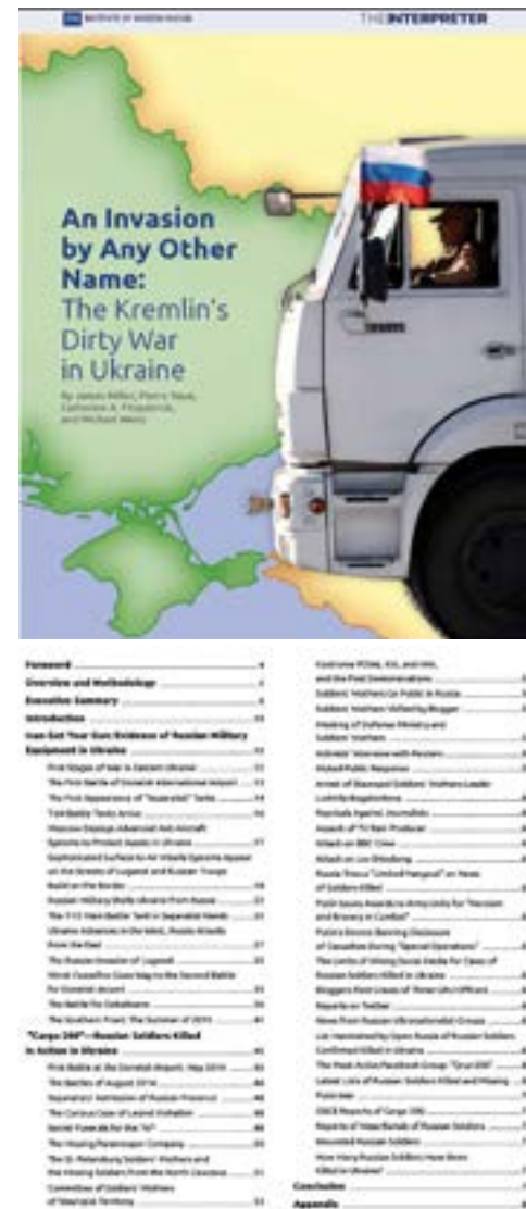
Обкладинка і зміст: An Invasion by Any Other Name: The Kremlin's Dirty War in Ukraine / J. Miller, P. Vaux, C. A. Fitzpatrick, M. Weiss. New York, 2015. 86 p.

Зроблено цілком обґрунтовані висновки про те, що у квітні 2014 р. Кремль розпочав гібридну війну на сході України, залучивши своїх агентів для її організації та керівництва, забезпечивши фінансування, озброєння, бійців-добровольців, підтримку регулярними військами. Офіційна Москва запустила масштабну дезінформаційну кампанію з метою переконати російський народ і світ, що війна на сході України є внутрішньою громадянською. Деякі лідери західних країн уникали згадок про війну Росії проти України, зволікали з усвідомленням смертельної небезпеки, яку несе відверто ревізійністська зовнішня політика Кремля. На порядку денному постало питання про збільшення розвіду-