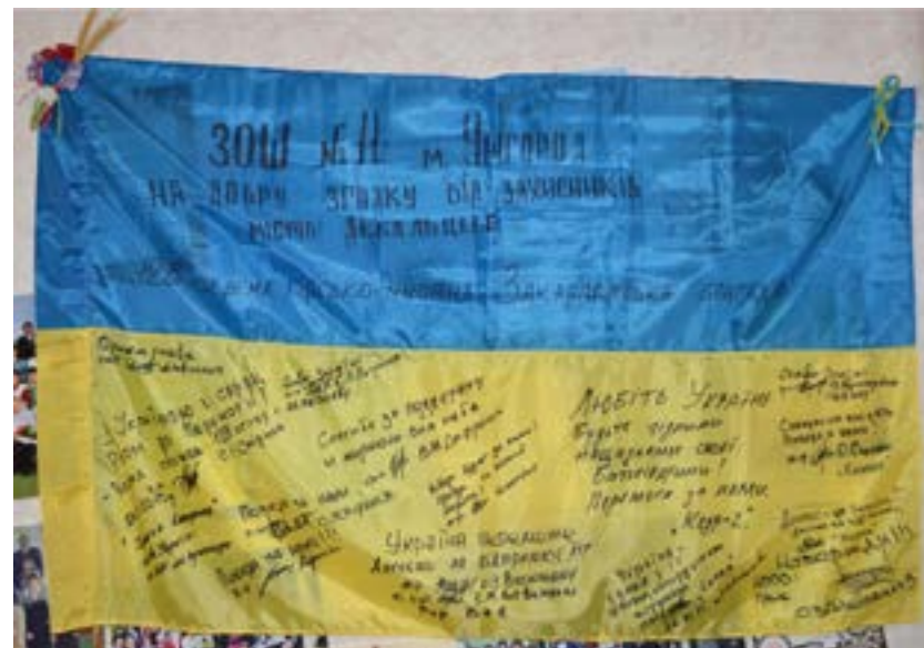
Державний прапор України з автографами захисників Дебальцевого – бійців 128-ої гірсько-піхотної Закарпатської бригади, подарований Ужгородській загальноосвітній школі № 11.

ло. Після підписання угоди 11 українських солдатів загинули і 40 отримали поранення, сепаратисти обстріляли артилерією понад 30 міст і сіл. США назвали залучення російських військ до нападу на Дебальцеве порушенням угоди. Туди перемістилися російські підрозділи протиповітряної оборони, а Росія приготувала сепаратистам велику партію поставок 1 . В. Путін намагався захопити Дебальцеве до припинення вогню і завдати політичного удару П. Порошенку. Водночас Росія гарантувала припинення вогню, не вважаючи себе учасником конфлікту.