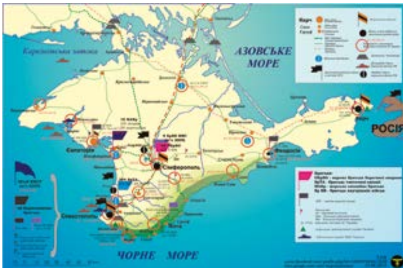
Карта військово-політичної ситуації в Криму в лютому-березні 2014 р.

Міжнародна спільнота і міжнародні інституції відразу кваліфікували дії Російської Федерації щодо України у 2014 р. як акт агресії, однозначно висловилися за територіальну цілісність України. Понад 30 років минуло з часу завершення Холодної війни, коли в другій декаді XXI ст. світ знову став на її порозі. Майже не помітний на карті світу півострів Крим став яблуком розбрату не тільки між «братніми» українським і російським народами, а й загострив відносини між країнами демократичного світогляду й антизахідних стереотипів.