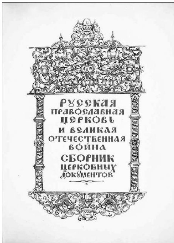
«Русская православная церковь и Великая Отечественная война. Сборник церковных документов». Издание Московской Патриархии 1943 г. 100 стр.