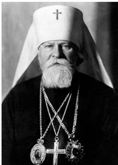
Митрополит Николай (Ярушевич), редактор Журнала Московской Патриархии с 1946 по 1960 гг.

создания книги проходил под строгим государственным контролем. Книга в основном была выпущена в пропагандистских целях, в расчете на то, чтобы смягчить международное общественное мнение о жестоком гонении на Церковь в Советском Союзе, и поэтому главным образом предназначалась для союзнических стран. Она была издана 50-тысячным тиражом на нескольких языках, что подтверждает заинтересованность в ее появлении советского руководства 2 . В экземплярах, предназначавшихся для реализации этого пропагандистского замысла в США, русский текст был набран латинскими буквами. Прекрасный кожаный переплет, хорошая печать сделали это издание подарочным. По линии Министерства иностранных дел СССР экземпляры были переданы