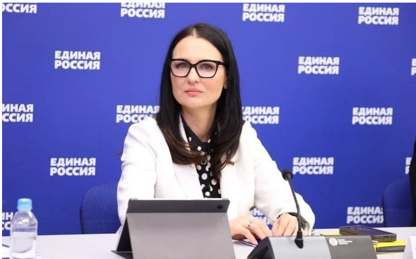
Татьяна Буцкая.

Депутат Госдумы Буцкая пожаловалась в Минюст на то, что новорожденной девочке в Уфе якобы дали мужское имя Кирилл. Налицо откровенная ЛГБТ-пропаганда, — решила Буцкая. И ладно бы дело было лишь в родителях-оригиналах. Но ведь «Кирилла» зарегистрировали в ЗАГС! То есть эта самая пропаганда пустила корни в органах регистрации гражданского состояния. Тут и до гей-свадьбы недалеко.