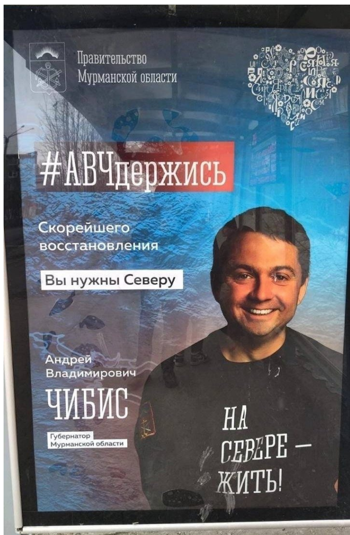
Баннер с пожеланиями здоровья губернатору Чибису.

Пожелания здоровья пережившему покушение Мурманскому губернатору Чибису появились на баннерах в городах региона. Примечательно, что на плакатах имеется логотип правительства области, что позволяет предположить, за чей счет эти «открытки» были заказаны. Между тем сенатор Константин Долгов предположил, что Чибиса пырнули ножом по указанию сатанистов: «В это вовлечены не только люди в ЦИПСО, МІБ, ЦРУ или подведомственных им структур. Это самые разные люди. Это не христиане и даже не раскольники. Это сатанисты». Для борьбы с темными силами председатель партии «Коммунисты России» Сергей Малинкович предложил выдать губернаторам оружие. Тогда уж и серебряные пули!