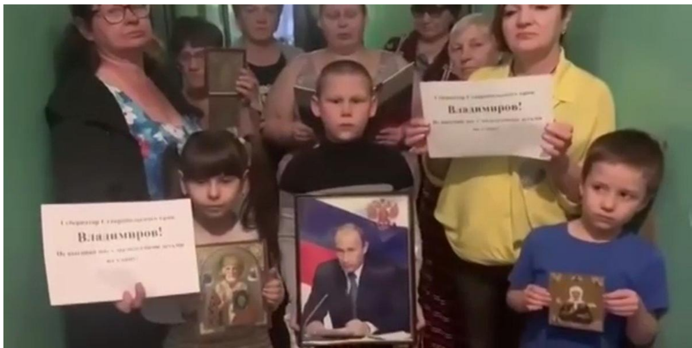
Жители Невинномыска записали видеожалобу В. Путину на губернатора. Скриншот

Жители Невинномыска обвинили ставропольского губернатора Владимирова в работе на украинские спецслужбы. Она, по версии граждан, записавших видеожалобу Путину, выражается в том, что их выселяют из аварийного дома. Нежелающие выселяться граждане, вооружась иконами и портретами президента, заявили, что Владимиров «работает в стоворе с внутренними врагами-иноагентами по указанию руководства зарубежных антироссийских центров в интересах спецслужб Украины и стран НАТО». Правда, постановление о признании дома аварийным готовила мэрия Невинномыска, а вовсе не губернатор, но идея про НАТО богатая и явно в родстве с историями о том, как американский президент гадил в подъездах россиян.