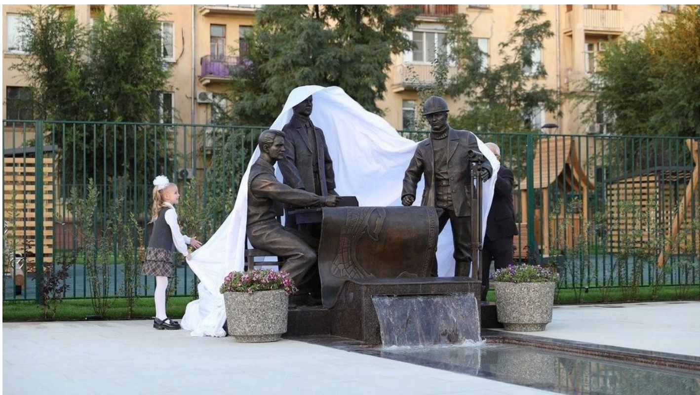
Скульптурная группа «Строители Сталинграда».