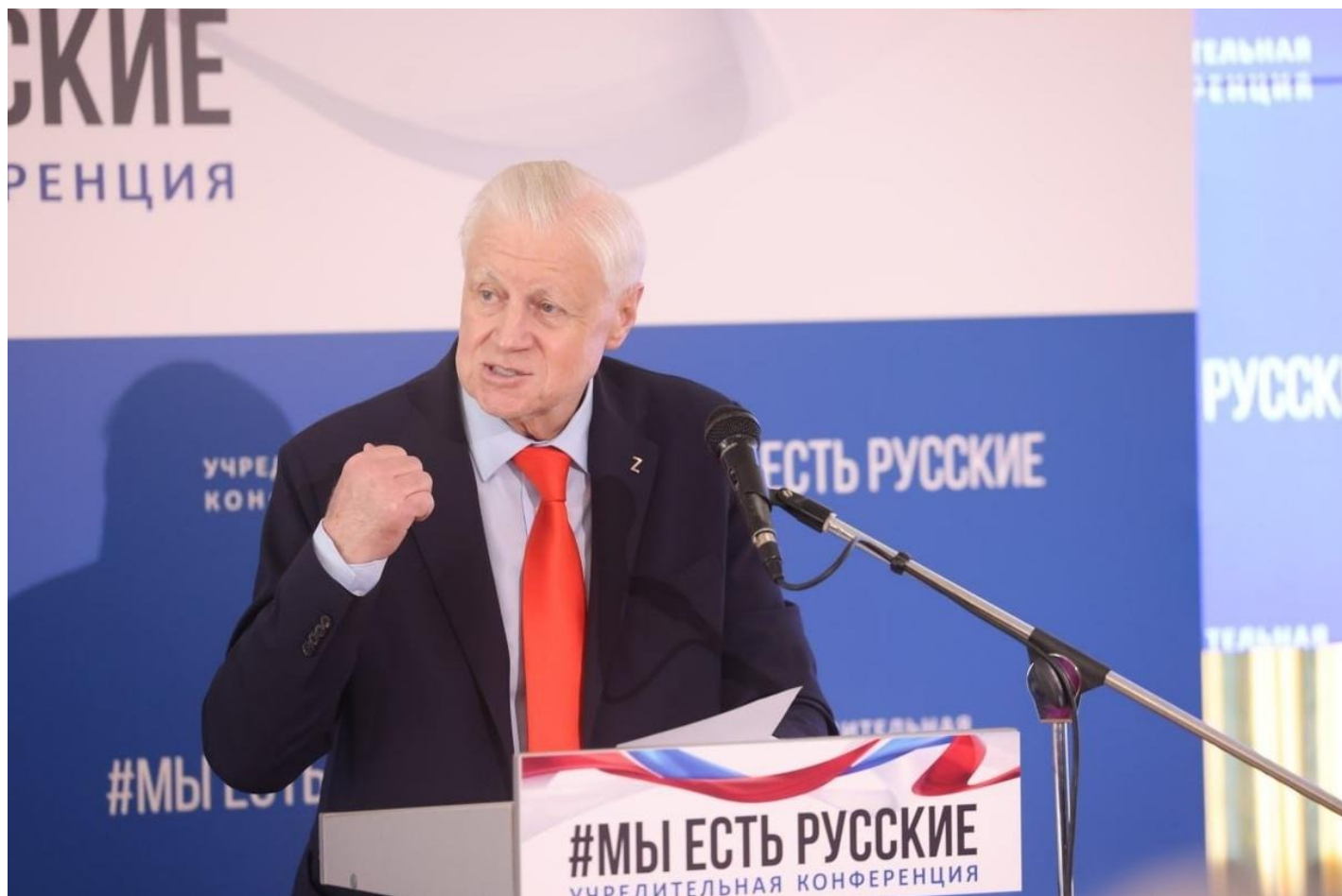
Сергей Миронов.

Депутат Госдумы Сергей Миронов, еще недавно позировавший с пригожинской кувалдой, взялся за мигрантов. Он призвал изгнать их с «новых территорий». По версии депутата, наличие в Мариуполе рабочих из Средней Азии мешает его жителям радоваться освобождению от фашизма. Фашизм, в изложении Миронова, украинский. А борьба с людьми неславянского происхождения — отечественная.